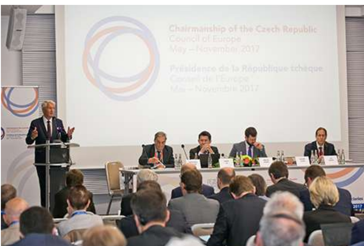
20. 6. 2017, Úvodní den jednání konference, Hotel International Brno

Zleva: Pavel Šámal, předseda Nejvyššího soudu; Bohuslav Sobotka, předseda vlády ČR; Thorbjørn Jagland, generální tajemník Rady Evropy