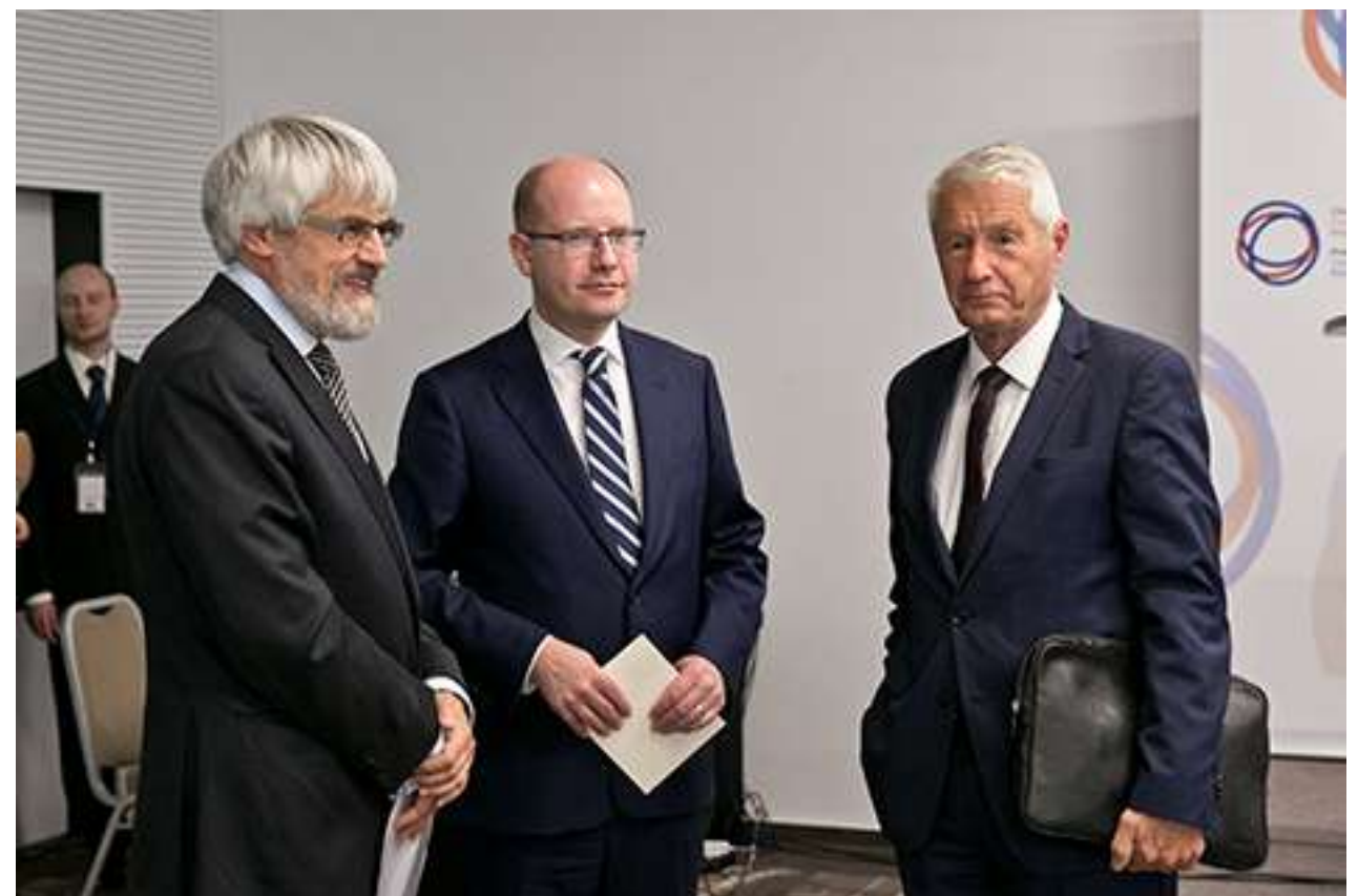
20. 6. 2017, Úvodní den jednání konference, Hotel International Brno