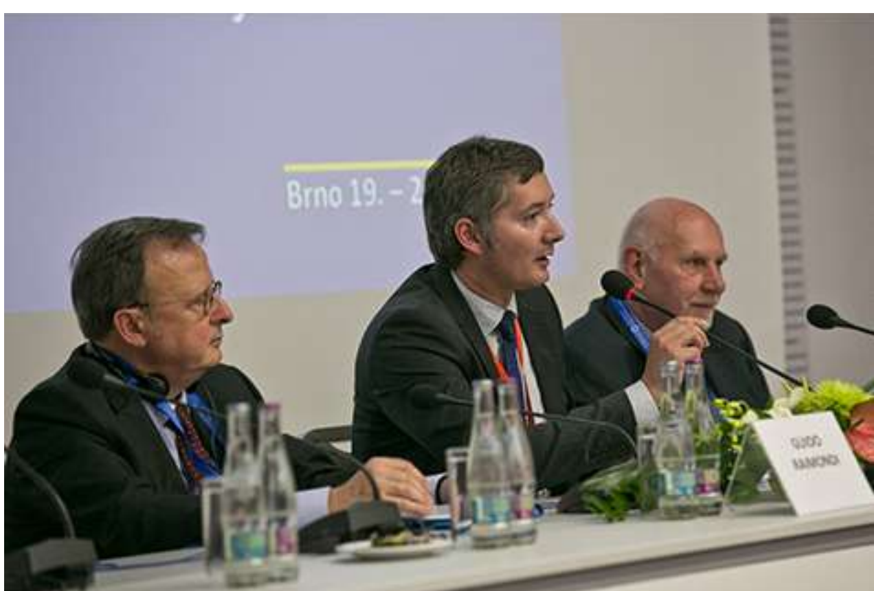
20. 6. 2017, Úvodní den jednání konference, Hotel International Brno

Historický jídelní stůl, v pozadí stěna z makassarského ebenu.