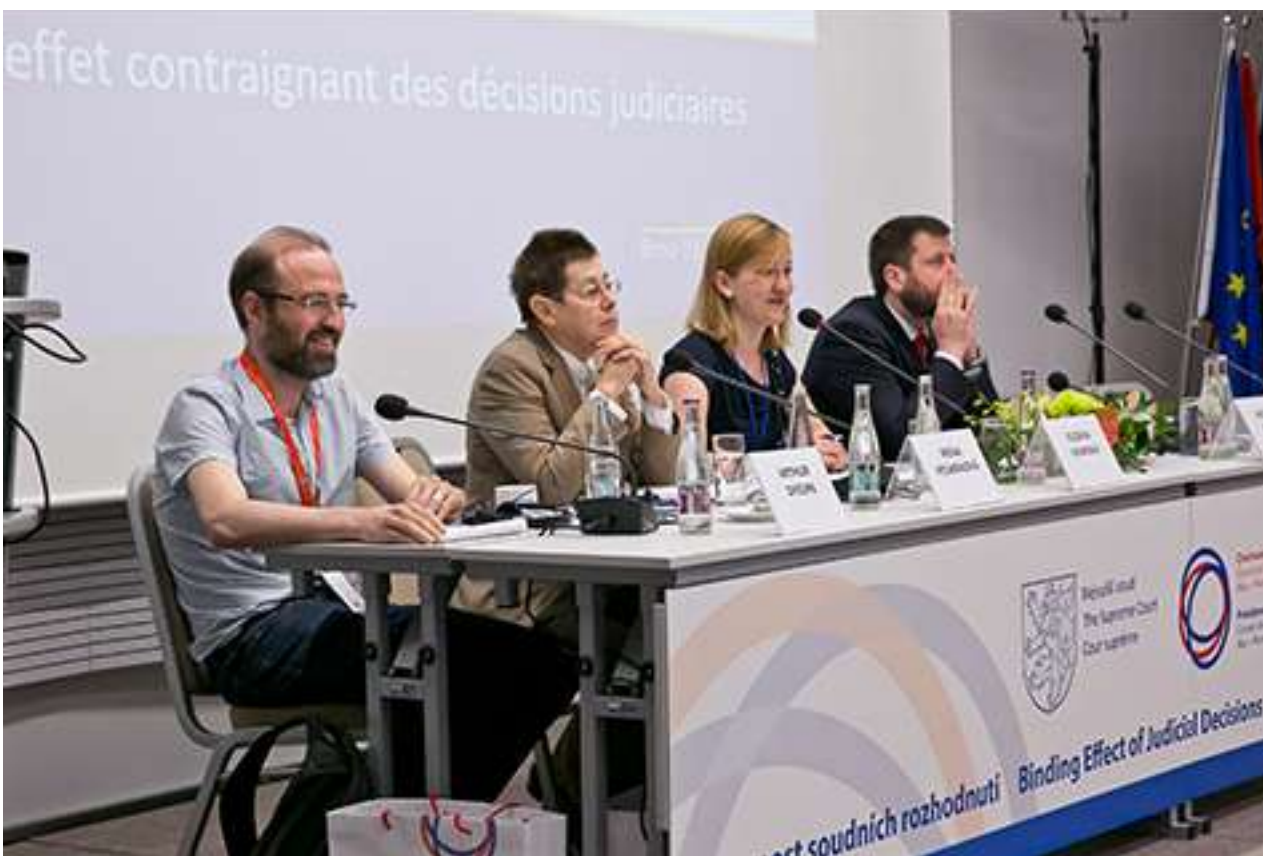
21. 6. 2017, Závěrečný den konference, Hotel International Brno