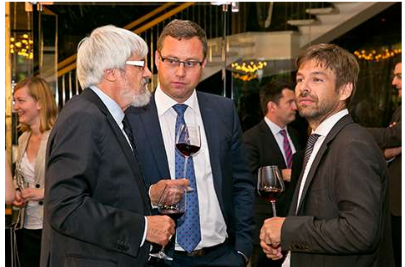
19. 6. 2017, Slavnostní zahájení konference, Hotel International Brno