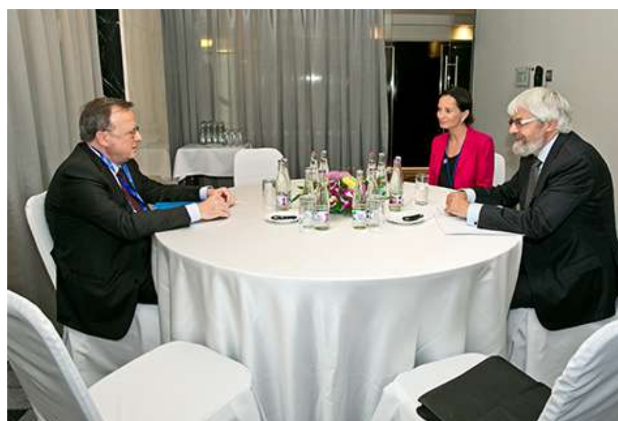
20. 6. 2017, Úvodní den jednání konference, Hotel International Brno