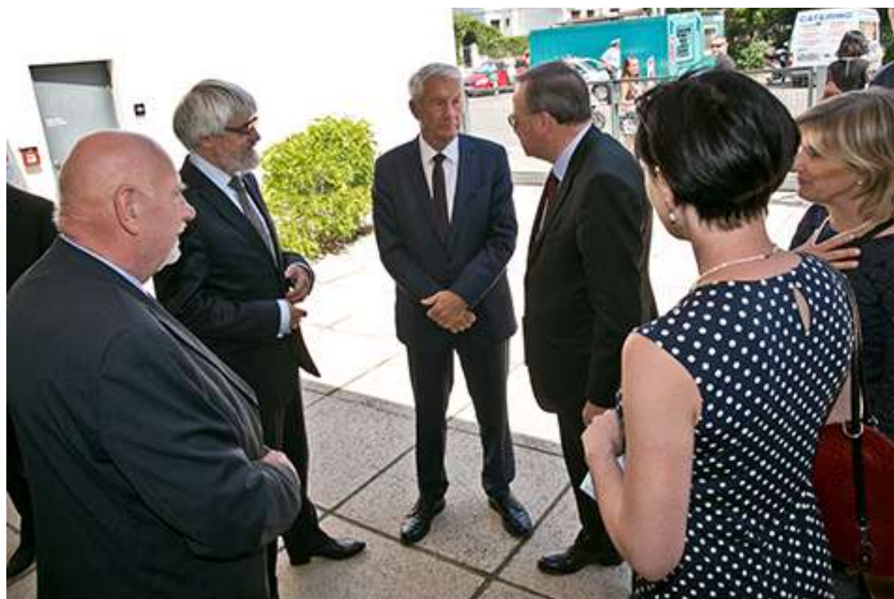
20. 6. 2017, Slavnostní oběd, vila Tugendhat

Příjezd na slavnostní oběd do vily Tugendhat