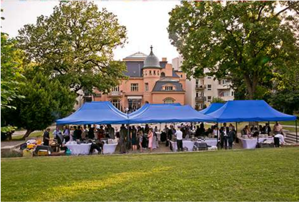
20. 6. 2017, Slavnostní večerní recepce, Löw-Beerova vila

Löw-Beerova vila se nachází v těsném sousedství vily Tugendhat, slavnostní recepce byla tedy spojena s prohlídkou této památky UNESCO