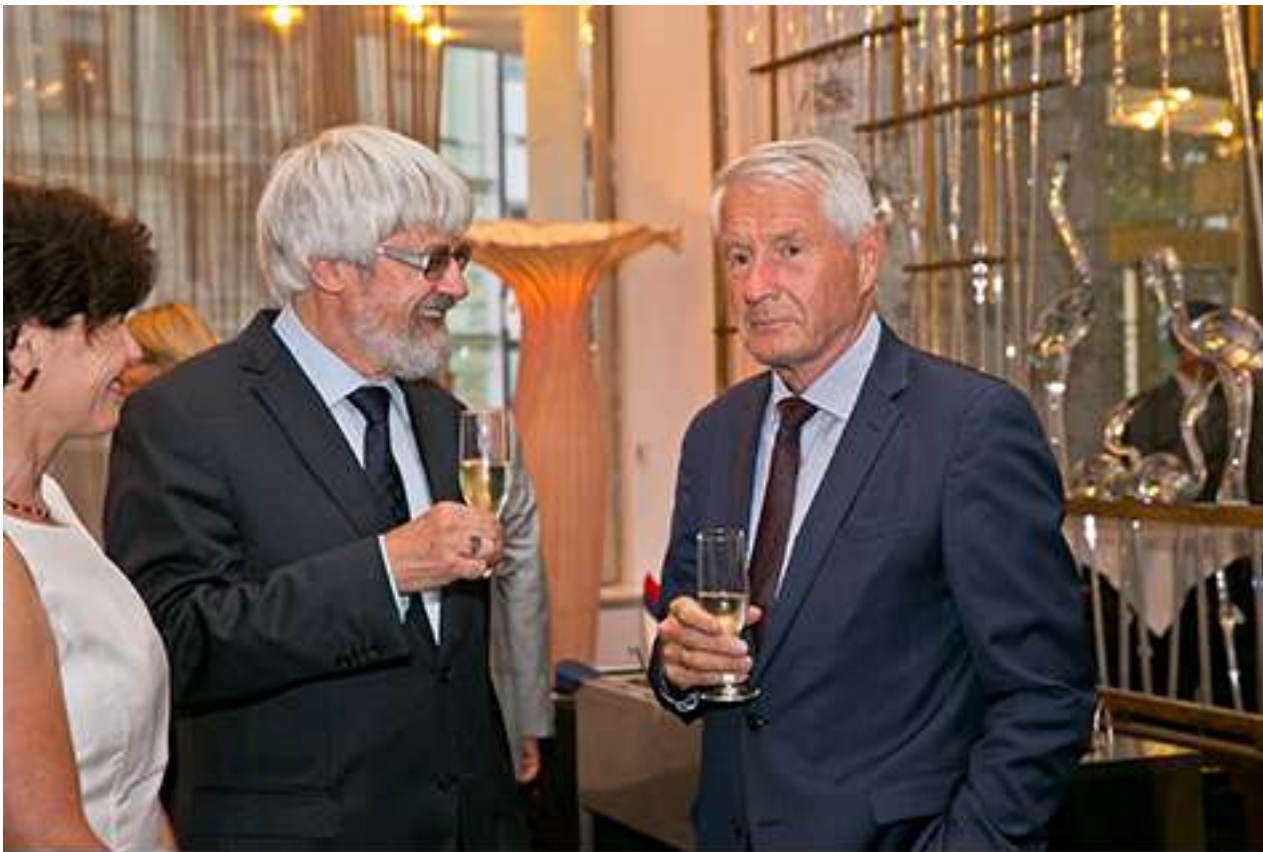
19. 6. 2017, Slavnostní zahájení konference, Hotel International Brno

Konference Závaznost soudních rozhodnutí se konala za významné podpory Rady Evropy a Ministerstva spravedlnosti ČR. I poté, co tato akce skončila, Nejvyšší soud nadále provozuje speciální webové stránky konference http://conference2017.supremecourt.cz , kde ve třech jazycích zveřejnil videozáznamy všech příspěvků, které v rámci jednotlivých panelů konference zazněly. Je zde také možnost shlédnout fotogalerii. Aktuálně se rovněž připravuje tištěný sborník všech příspěvků.