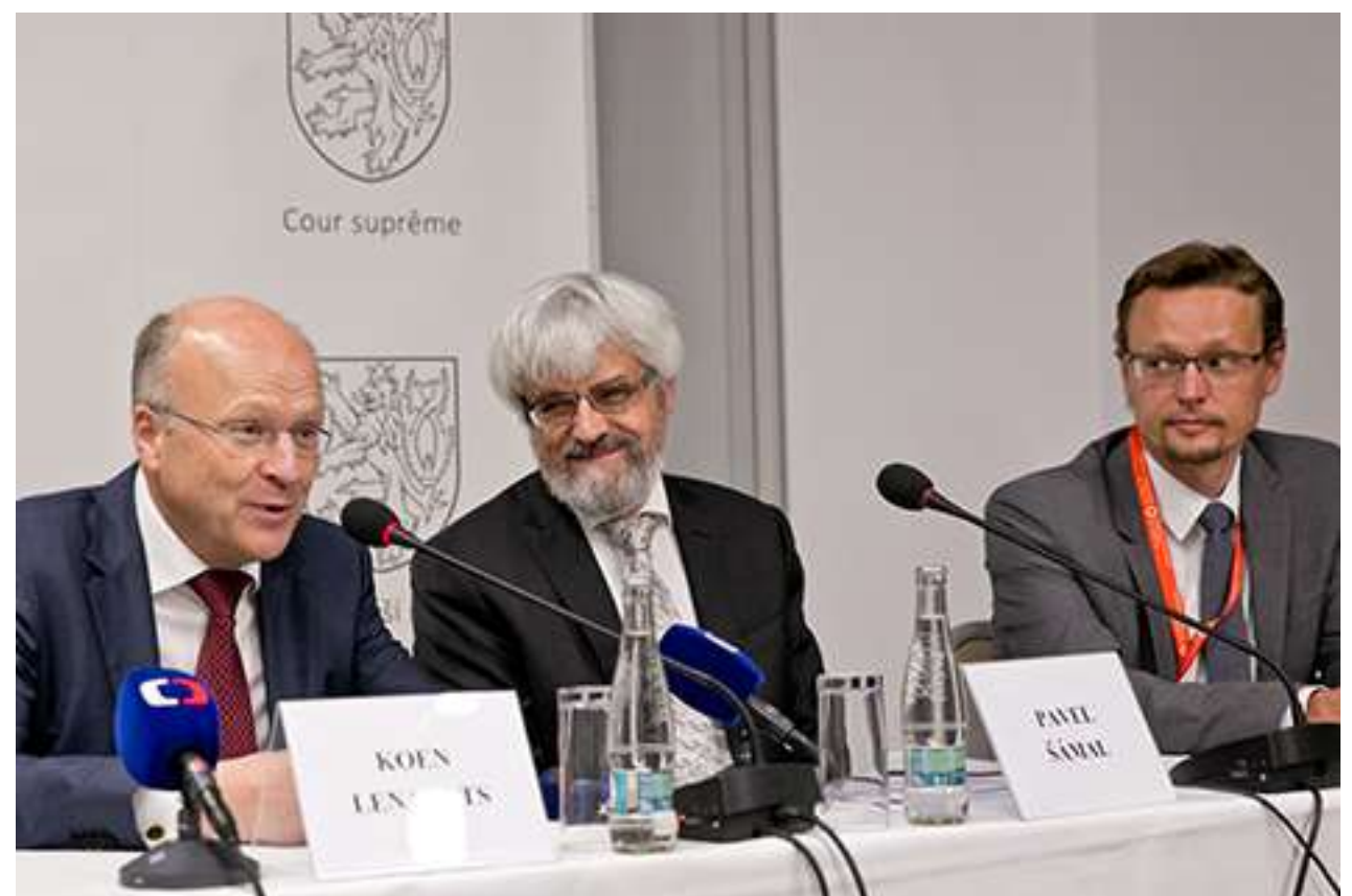
21. 6. 2017, Závěrečný den konference, Hotel International Brno