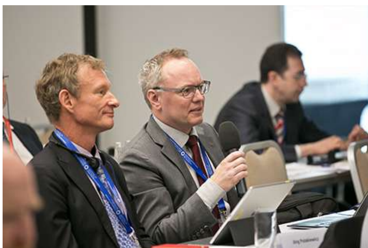
20. 6. 2017, Úvodní den jednání konference, Hotel International Brno