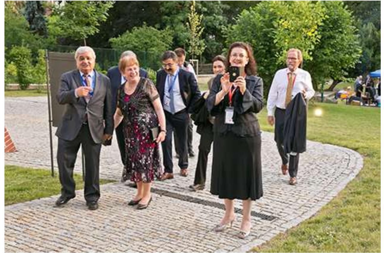
20. 6. 2017, Slavnostní večerní recepce, Löw-Beerova vila

Löw-Beerova vila se nachází v těsném sousedství vily Tugendhat, slavnostní recepce byla tedy spojena s prohlídkou této památky UNESCO