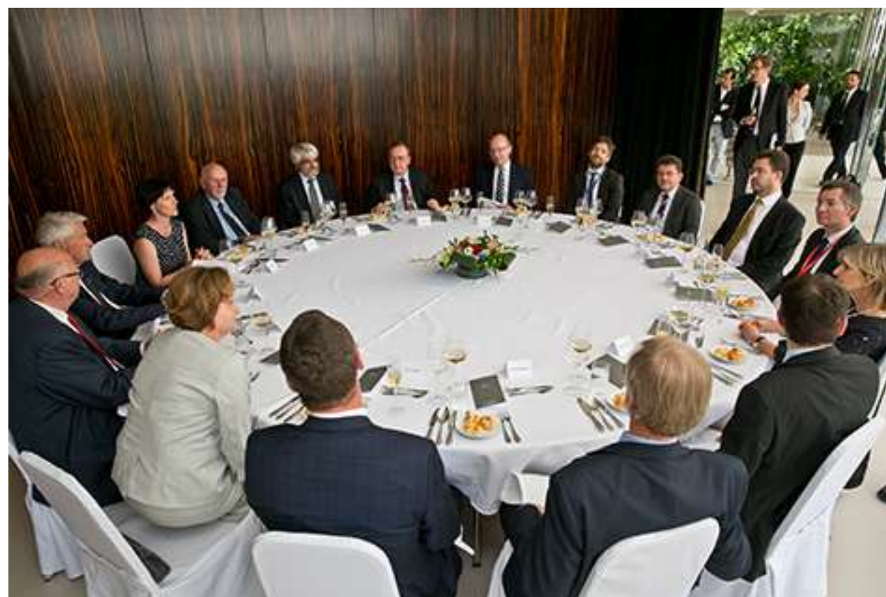
20. 6. 2017, Slavnostní oběd, vila Tugendhat

Příjezd na slavnostní oběd do vily Tugendhat