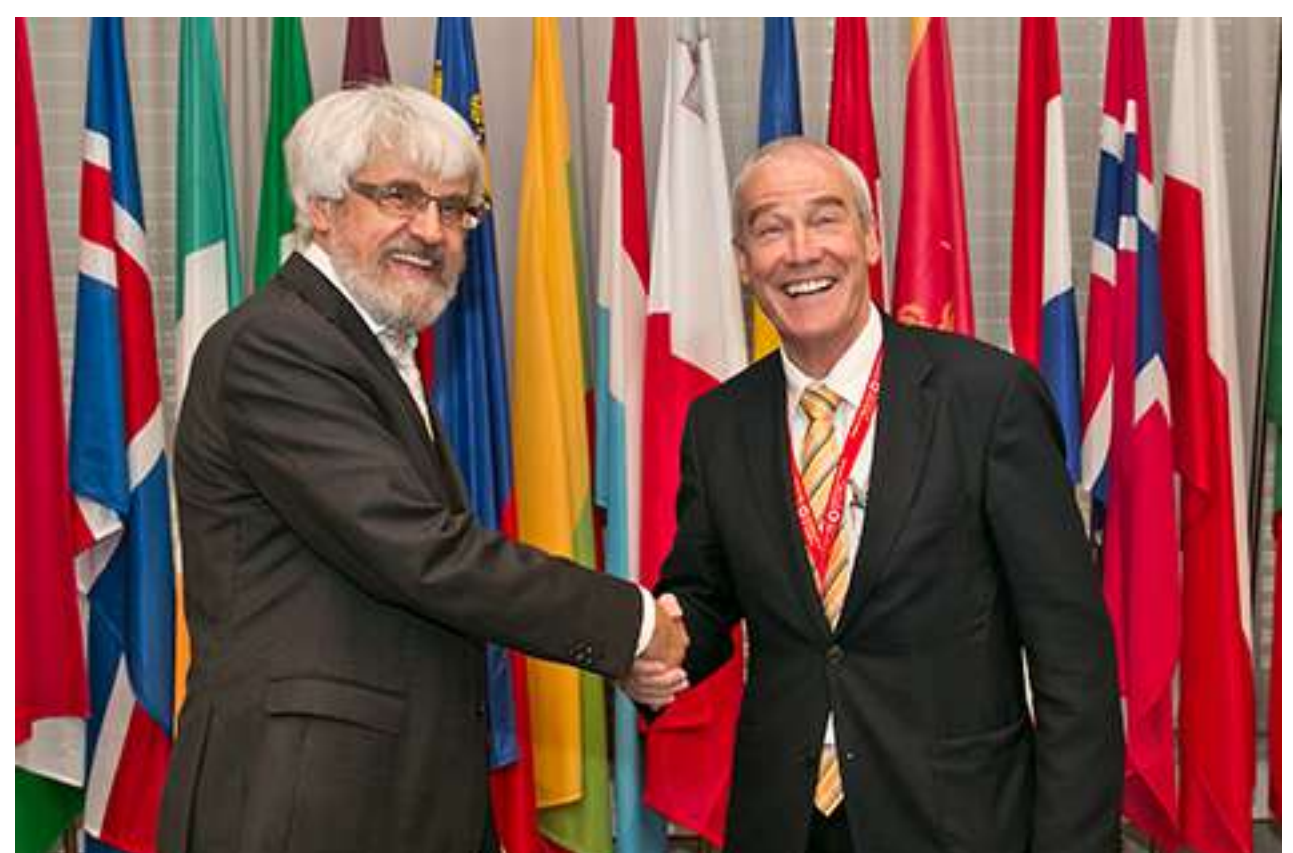
20. 6. 2017, Úvodní den jednání konference, Hotel International Brno

Zdravice generálního tajemníka Rady Evropy Thorbjørna Jaglanda v úvodu konference Závaznost soudních rozhodnutí