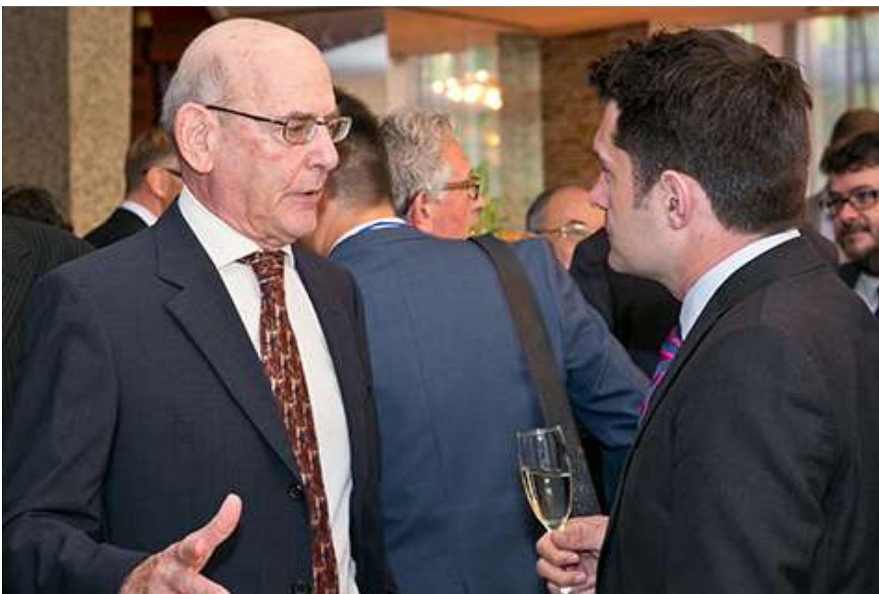
19. 6. 2017, Slavnostní zahájení konference, Hotel International Brno

Zleva: Pavel Šámal, předseda Nejvyššího soudu; Pavel Zeman, nejvyšší státní zástupce; Robert Pelikán, ministr spravedlnosti