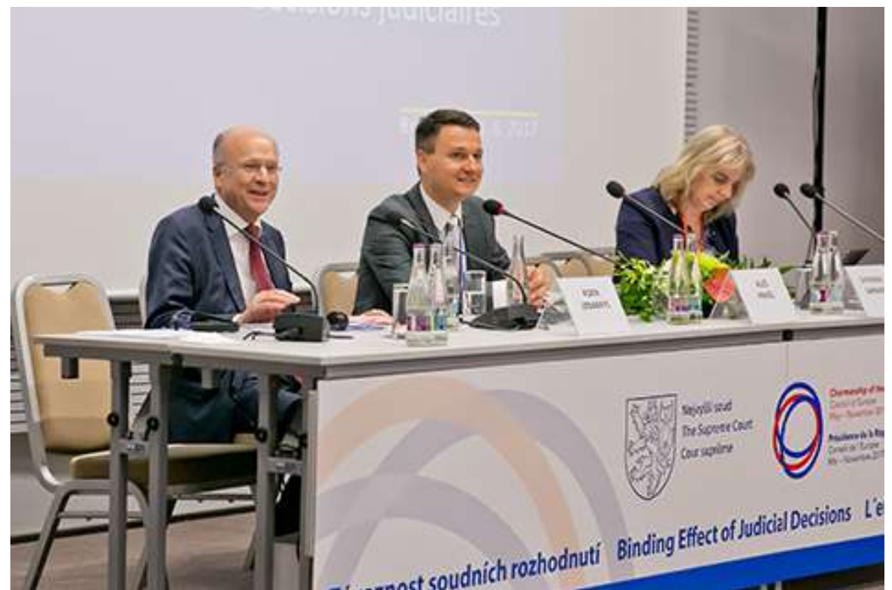
21. 6. 2017, Závěrečný den konference, Hotel International Brno