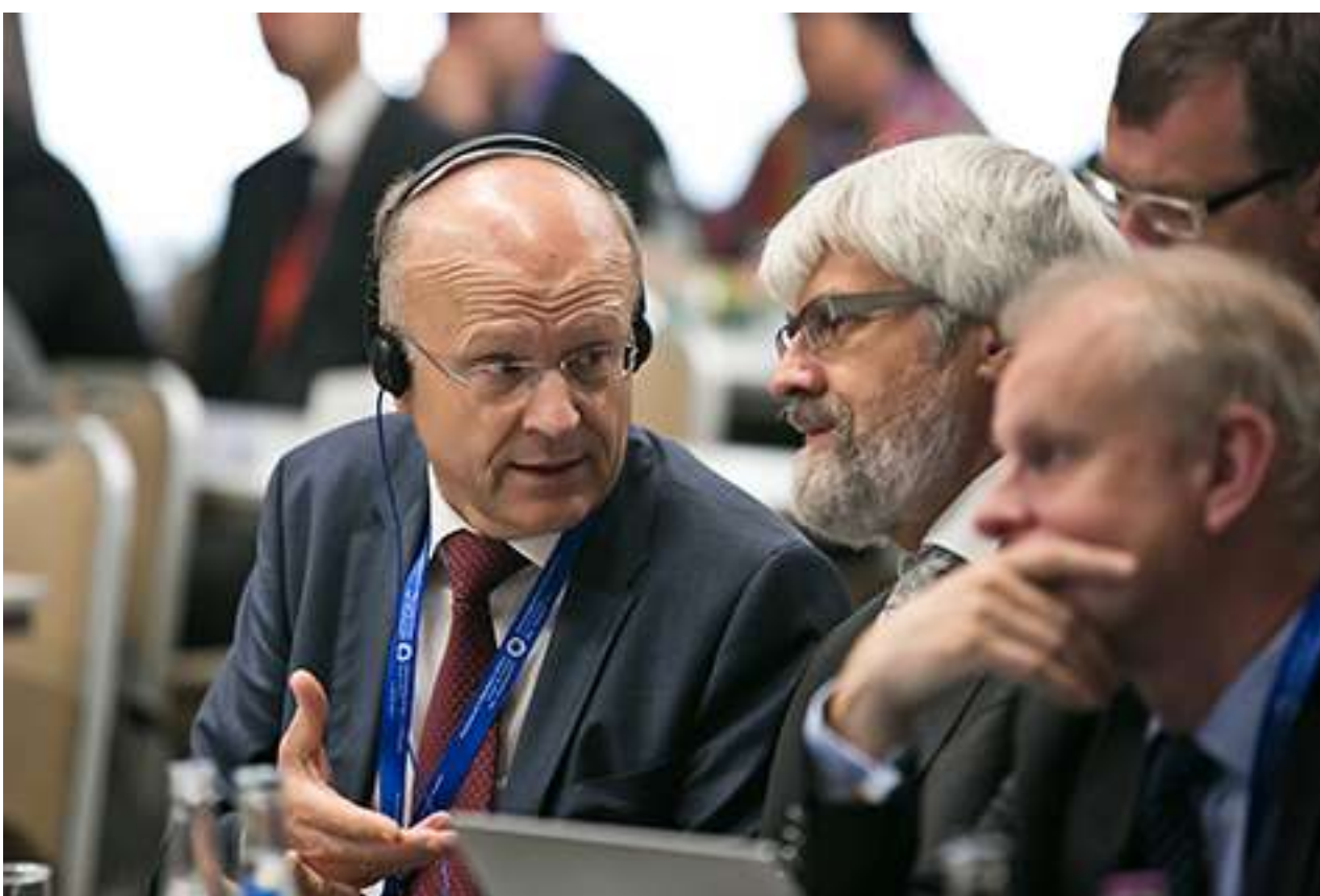
21. 6. 2017, Závěrečný den konference, Hotel International Brno