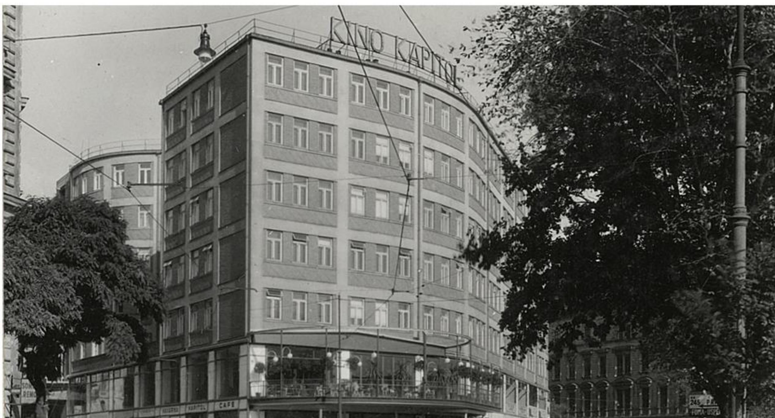
Palác Morava, 40. léta 20. století, pohled na budovu od brněnského hlavního nádraží