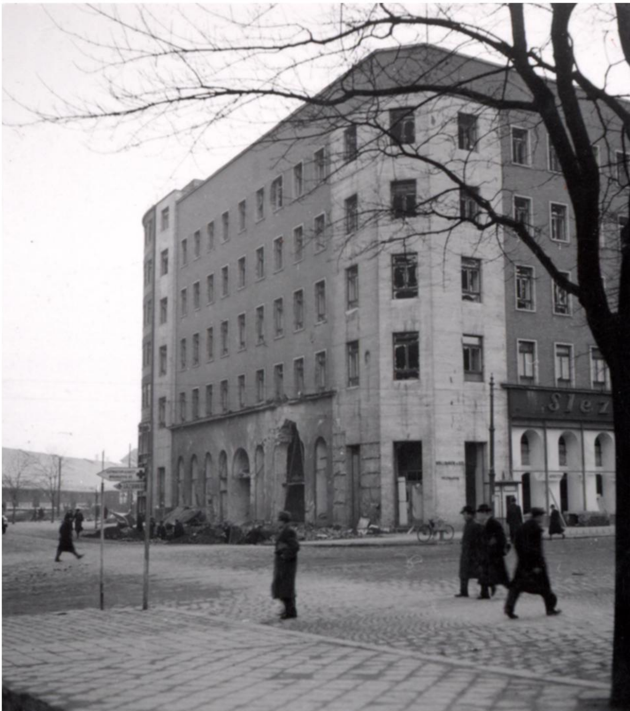
Palác Morava poškozený bombardováním

Spojenci se za tento tragický nálet na Brno po válce omluvili. V Benešově ulici, nedaleko Paláce Kapitol, sídlilo policejní ředitelství, kde bombardování zabilo všechny přítomné. V základní škole na Mendlově náměstí zahynulo v krytu na čtyřicet dětí. Kryt totiž zalila horká voda z bombou zasaženého parního potrubí vedoucího do pivovaru. Bombardéry však neletěly jen nad Brno, ale mezi dalšími náhradními cíli byla ten den také Břeclav nebo Hodonín.