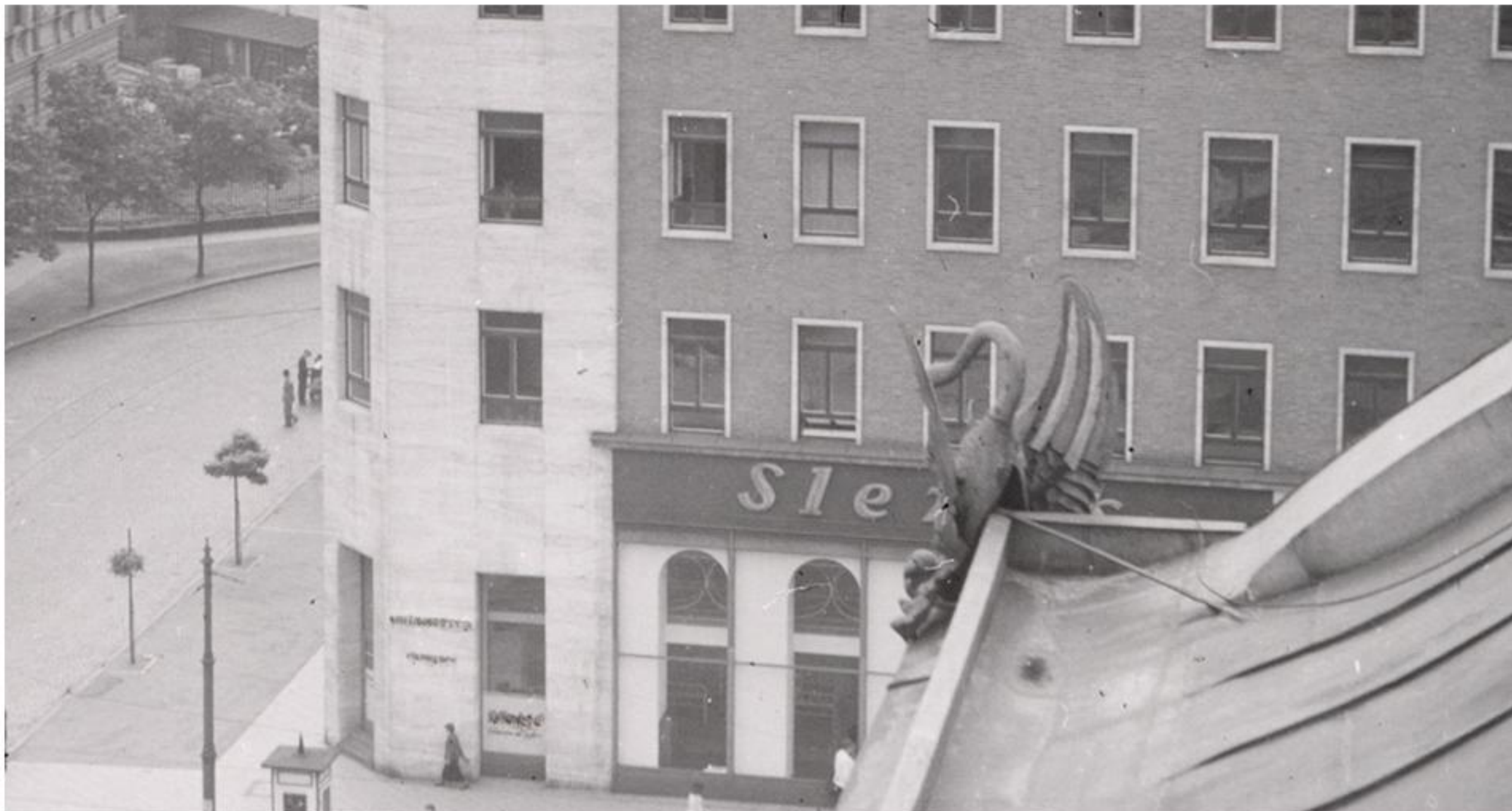
Palác Morava, 30. léta 20. století, kdy zde pracovala část soudců a dalších zaměstnanců Nejvyššího soudu

I po skončení II. světové války a zániku tehdejšího Slovenského státu, kdy došlo k opětovnému „sloučení justice“ v českých zemích a na Slovensku, nadále existovaly Nejvyšší soud v Bratislavě a Nejvyšší soud v Brně. V červnu roku 1945 uzavřela vláda ČSR se Slovenskou národní radou dohodu o tom, že nejvyšší soudní tribunály (Nejvyšší soud a Nejvyšší správní soud) budou společné pro území celé republiky. Následně bylo toto ujednání v dubnu roku 1946 pozměněno v tom duchu, že nejvyšší soudy v Brně a Bratislavě se považují, při zachování jejich dosavadní organizace a působnosti podle předpisů pro ně platných, za součást jednotného Nejvyššího soudu, který má sídlo v Brně.