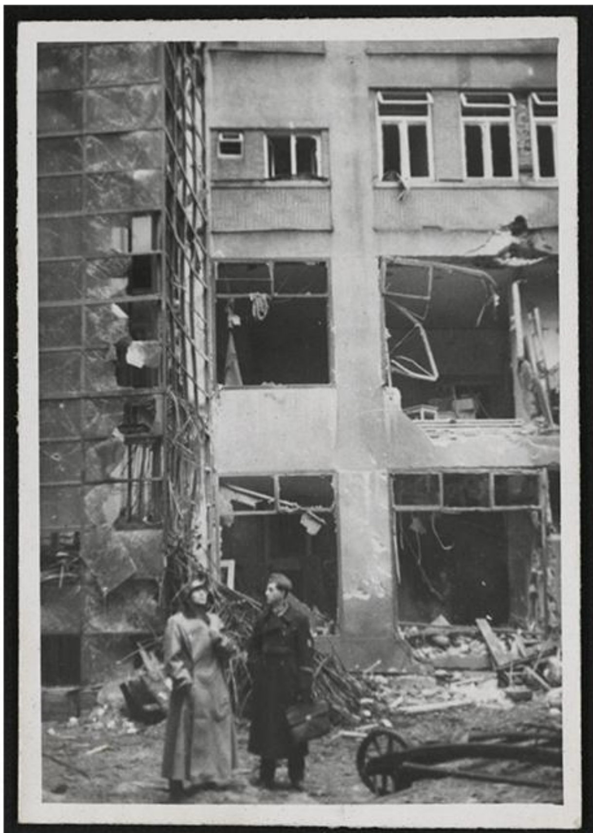
Palác Morava, kde si Nejvyšší soud pronajímal kanceláře, poškozený bombardováním

Také v aktuálním čísle AEQUITAS se ohlížíme do minulosti a pokoušíme se zmapovat uplynulých 100 let historie Nejvyššího soudu. V předchozím vydání jsme se věnovali zřízení Nejvyššího soudu zákonem č. 5/1918 Sb. ze dne 2. listopadu 1918 a jeho činnosti za první republiky. Všimli jsme si především problémů, které měl soud s nedostatečnou kapacitou svého sídla, Justičního paláce v dnešní Rooseveltově ulici v Brně, dříve v ulici Na Hradbách. Dnes si připomeneme nejtragičtější událost, která postihla Nejvyšší soud s blížícím se koncem II. světové války. Při spojeneckém náletu 20. listopadu 1944 zemřelo v protiletectvém krytu v centru Brna sedm soudců, tři úřednice, dva úředníci a čtyři zřizenci Nejvyššího soudu.