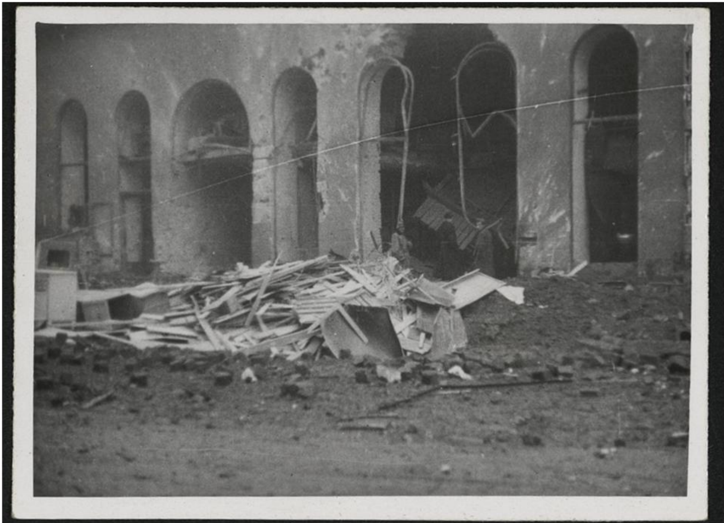
Palác Morava poškozený bombardováním

Nejvýznamnějším a nejvyužívanějším detašovaným pracovištěm Nejvyššího soudu v Brně byl tou dobou vedle sídla v Justičním paláci v Rooseveltově ulici také Palác Morava, známý jako Palác Kapitol, pojmenovaný podle stejnojmenného kina, postaveného v suterénu budovy. Palác, přestavěný za první republiky na polyfunkční dům, tvoří domovní blok mezi dnešním Malinovského náměstím a ulicemi Divadelní a Benešovou. Při historicky nejničivějším anglo-americkém náletu spojenců na Brno v poledne 20. listopadu 1944 zasáhla jedna z bomb přímo protiletadlový kryt, kam se lidé z Paláce Morava uchýlili. Uvnitř krytu tenkrát zahynulo 7 soudců, 3 soudní úřednice, 2 úředníci a 4 soudní zřízenci Nejvyššího soudu. Ničivý účinek bomby zapříčinila nešťastná náhoda, protože letecká puma se do bezprostřední blízkosti krytu dostala bokem, když sklouzla po zdi domu a vybuchla až v podzemí. Následkem toho se zřítil strop krytu. Paradoxně lidé, kteří tenkrát zůstali v samotné budově, přečkali nálet bez jakékoli úhony.