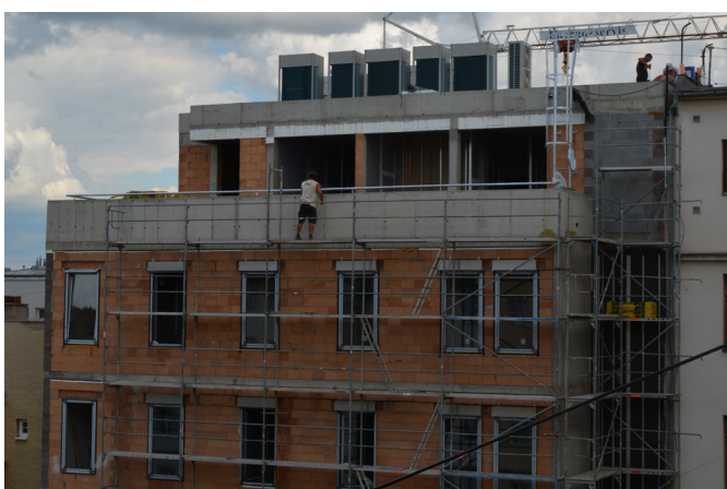
21. 6. 2019 Zadní trakt