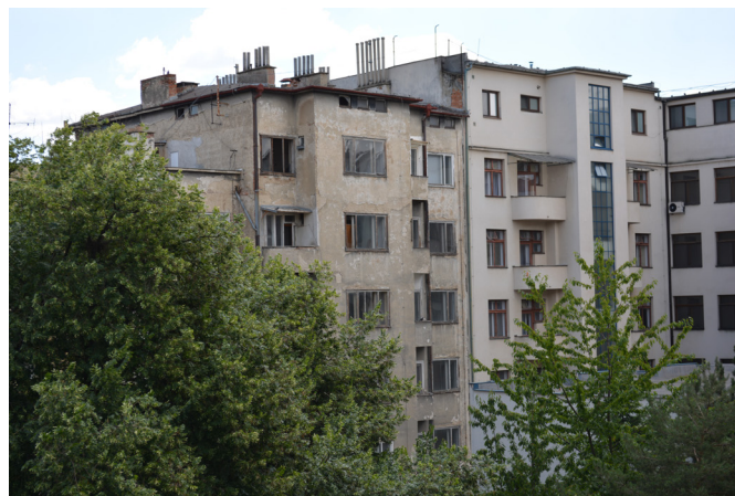
28. 3. 2017 Zadní trakt