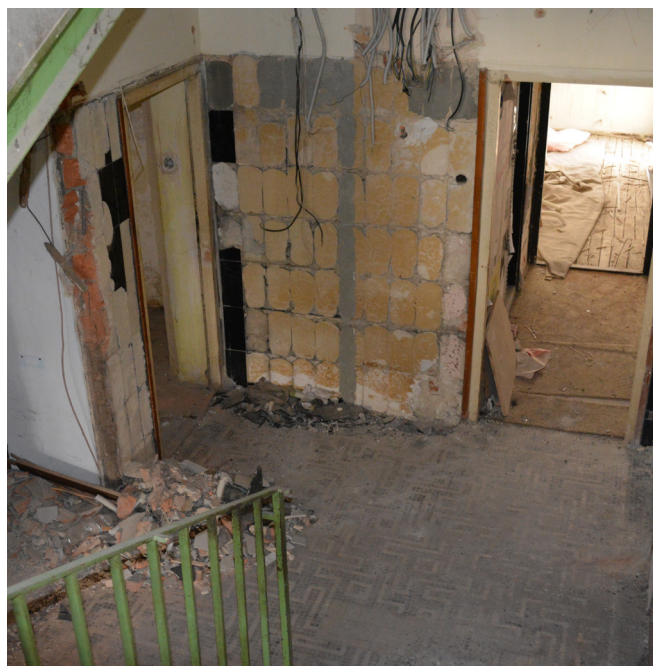
Na některých chodbách po vystěhování bývalých nájemníků nezůstaly ani obklady

K tomu, aby začaly na stavbě pracovat první stroje, byla ale ještě dlouhá cesta. Nejvyšší soud nemohl tak náročnou stavbu financovat z vlastního rozpočtu, proto ji nejprve převedl do majetku Ministerstva spravedlnosti. Aby byly veškeré přípravné práce, respektive vyřizování všech administrativních náležitostí, co nejrychlejší, vůbec se neuvažovalo o tom, že by měl být původní projekt, který v roce 2005 získal stavební povolení, výrazněji pozměněn a přepracován. Mimochodem, ukázalo se, jak nadčasový a kvalitní tento projekt byl. Samozřejmě, zčásti se i přesto musela projektová dokumentace uzpůsobit aktuálním potřebám soudu, projektanti Arch.Designu reagovali na nové trendy ve stavebnictví, materiály a technologie. Aby se dodržely původní závazky dané památkářům, zůstal prakticky nezměněn schválený původní vzhled vnějšího pláště budovy. Už v roce 2005 k němu projektanti přistupovali se zadáním citlivě navázat na památkově chráněnou funkcionalistickou budovu z 30. let 20. století, projektovanou věhlasným brněnským architektem Emilem Králíkem. Příjemným překvapením bylo, že i přes zdražení stavebních prací, energií a materiálů, ke kterému v uplynulém více než desetiletí došlo, se vítěz výběrového řízení na zhotovitele, stavební firma Zlínstav, zavázala projekt realizovat výrazně levněji, než na kolik byly náklady vypočítány v roce 2005.