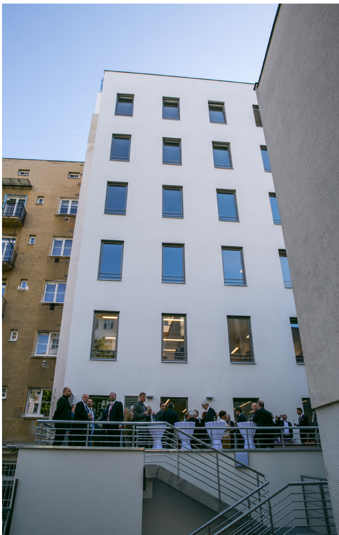
Zadní trakt nově vybudovaného křídla s terasou, která slouží jako odpočinková zóna pro soudce a zaměstnance soudu