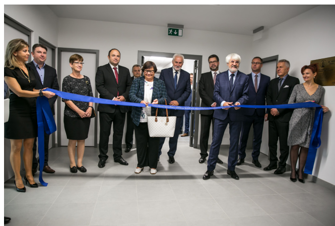
Slavnostní přestřižení pásky u jednoho z průchodů, kterými je v každém patře propojeno nové křídlo s historickou budovou Nejvyššího soudu