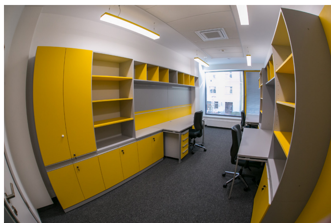
Pohled do jedné ze standardních kanceláří asistentů soudců