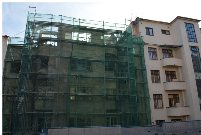
18. 8. 2017 Zadní trakt