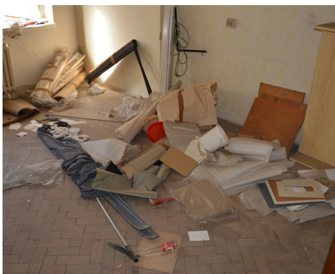
Jeden z vybydlených bytů v původním domě těsně před demolicí

Prvotní, velmi optimisticky odhadovaný termín dokončení stavby 31. srpna 2018, byl už hned v úvodních měsících, ještě před samotným zahájením stavebních prací a také v jejich úvodu, kvůli komplikacím, se kterými se dříve nepočítalo, postupně korigován.