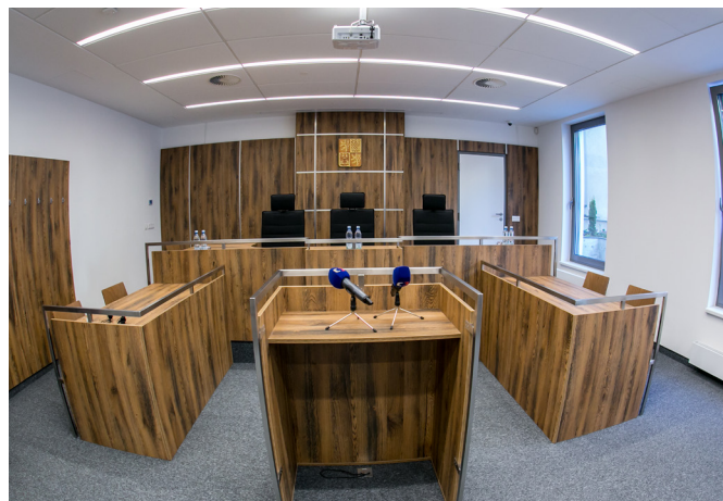
Nová jednací síň, která může po jednoduché přestavbě posloužit vždy také jako multifunkční místnost pro pořádání některých odborných akcí