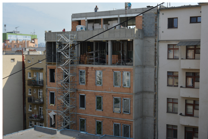
27. 5. 2019 Zadní trakt