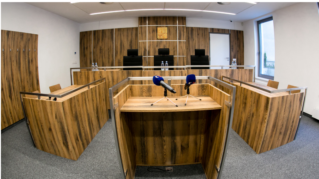
Nová jednací síň může sloužit také k jiným odborným anebo společenským akcím, Nejvyšší soud v ní začal pořádat například své tiskové konference.