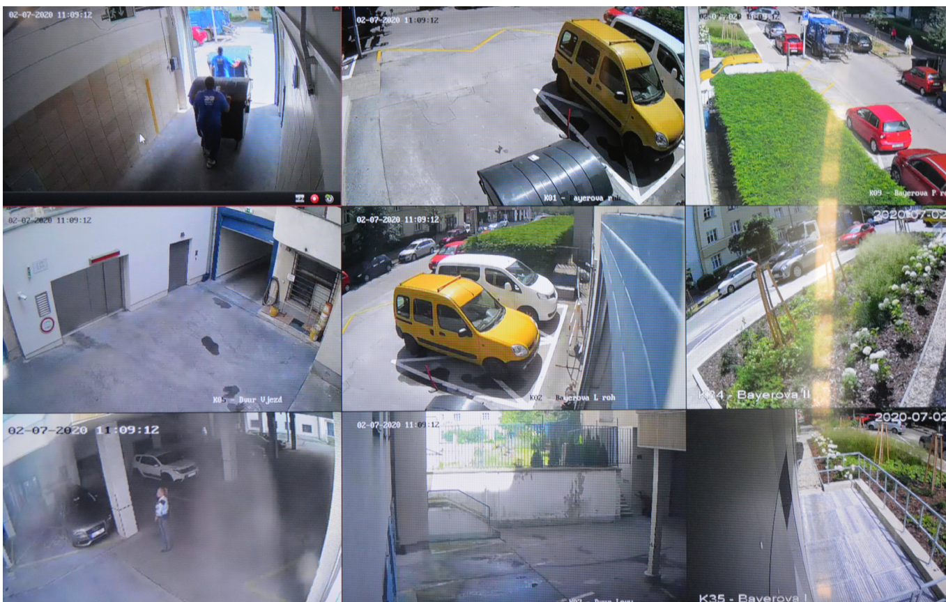
Jedna z obrazovek, kam se na služebnu justiční stráže promítají aktuální záběry z bezpečnostních kamer. Těch je pochopitelně mnohem více, než ukazuje tato jediná vybraná obrazovka.

K prvnímu setkání s příslušníkem justiční stráže Nejvyššího soudu nemusí dojít až u vstupu do budovy, ale častokrát se odehraje už na parkovišti s vyhrazenými parkovacími místy před budovou anebo v přilehlých ulicích. Starají se totiž také o to, aby parkovací místa vyhrazená pro nejvyšší soudní instanci nikdo nezneužíval. Zvláště po zavedení modrých parkovacích zón ve městě Brně je to každodenní problém.