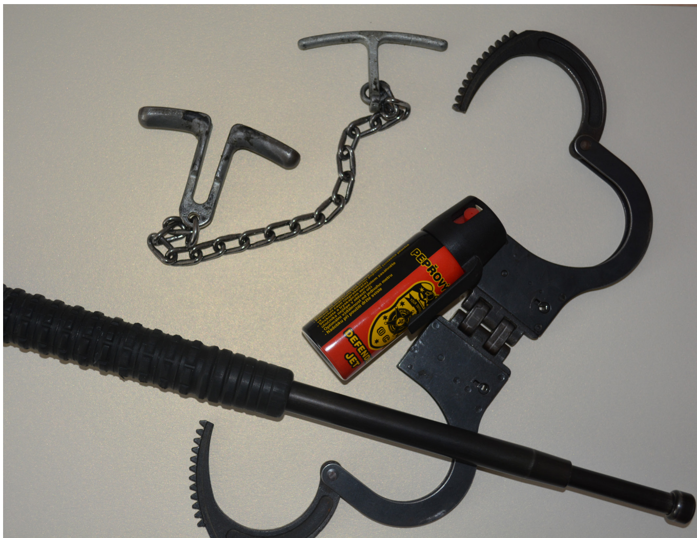
Ukázka části vybavení příslušníka justiční stráže Nejvyššího soudu.

Justiční stráž. Bezpečnostní kontroly, kterými musí návštěvníci projít hned u vstupu do každé soudní budovy v České republice, bývají přirovnávány k tomu, co absolvujeme na letištích. Speciální bezpečnostní rám, pohyblivý pás, kam je třeba položit zavazadlo, aby projelo tunelem s rentgenovým zařízením. Zbraně anebo předměty, které by mohly být použity jako zbraň, do soudní budovy nepatří. Pojďme si říci něco více právě o ostraze Nejvyššího soudu.