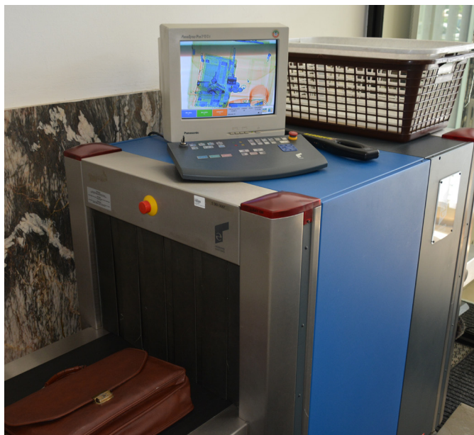
Rentgenová prohlídka zavazadel návštěvníků Nejvyššího soudu připomíná situace, které známe z letišť.

V zákoně o služebním poměru příslušníků bezpečnostních sborů se uvádí vzdělání v rozmezí střední až vysokoškolské v magisterském programu, takže záleží na aktuálních volných místech a potřebách vězeňské služby.