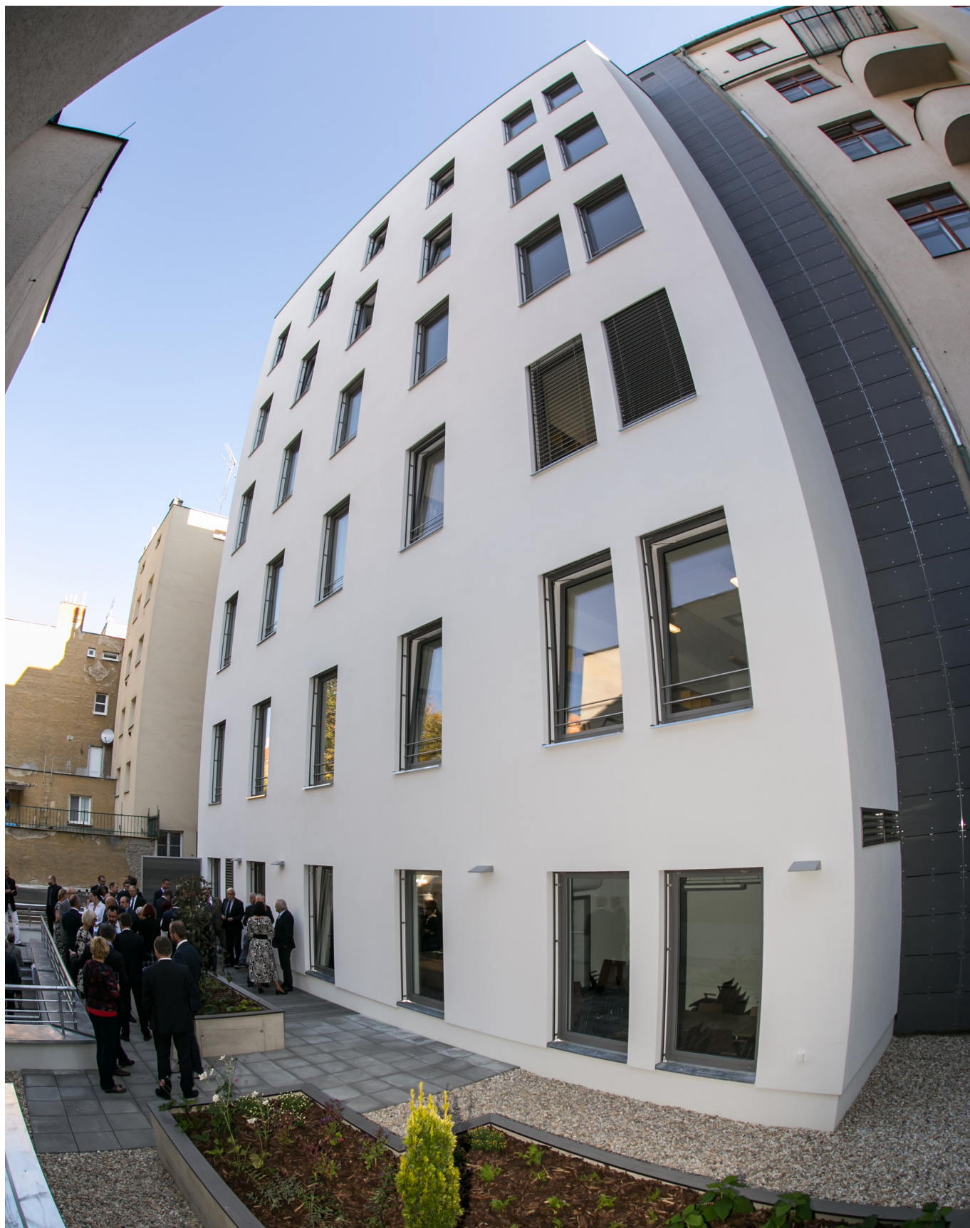
Zadní trakt budovy mohou spatřit jen návštěvníci soudu, nejlépe ze dvora, přes který se také vjíždí do podzemních garáží.