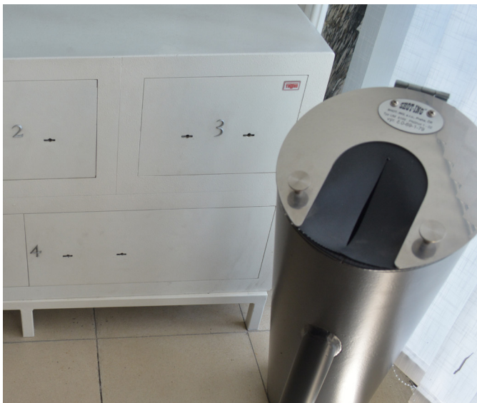
Zbraně a další nebezpečné předměty, které justiční stráž odejme návštěvníkovi, mohou být uschovány v trezoru. Napravo je na snímku speciální „vybíjecí“ zařízení, zbraň se samozřejmě nemůže ukládat do trezoru nabitá.

I když velitel justiční stráže hierarchicky nepodléhá předsedovi soudu, přesto musí justiční stráž postupovat vždy podle pravidel, která předseda Nejvyššího soudu jako osoba, jenž stojí v čele této instituce, nastavil. Předseda Nejvyššího soudu tak například určuje, koho může justiční stráž vpustit do budovy bez kontroly. Bývají to většinou ministerské a jiné vládní návštěvy, hosté, kteří zavítali do Brna na pozvání předsedy či místopředsedy Nejvyššího soudu ze zahraničí, soudci jiných českých soudů nebo státní zástupci, kteří se prokáží speciálními služebními průkazy apod.