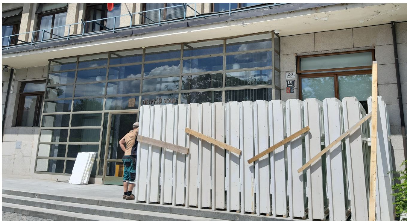
První dodávka ještě nenatřených replik historických oken dorazila 29. června.

Projektanti napočítali na vnějším plášti budovy celkem 42 druhů oken, dveří nebo jiných fasádních výplní. Často se jedná o okna kastlová nebo originálně vyrobená na zakázku v atypických rozměrech. O to budou jejich obnova, repase a výměna ještě složitější. První jednání s památkovým ústavem se uskutečnilo už v září roku 2017. Byla zadána a zpracována studie stavebně-energetických úspor, následně vznikl pasport stavby, tzn. její zjednodušená dokumentace. Vše památkáři znovu podrobně připomínkovali, až následně na to mohl být vypracován definitivní projekt a začal se vybírat dodavatel schopný vyrobit v přiměřeném čase a pokud možno co nejlevněji autentické repliky historických oken z bukového anebo smrkového dřeva, repasovat originální dřevěné balkónové dveře, ale také různé kovové prosklené stěny a fasádní výplně v železných rámech.