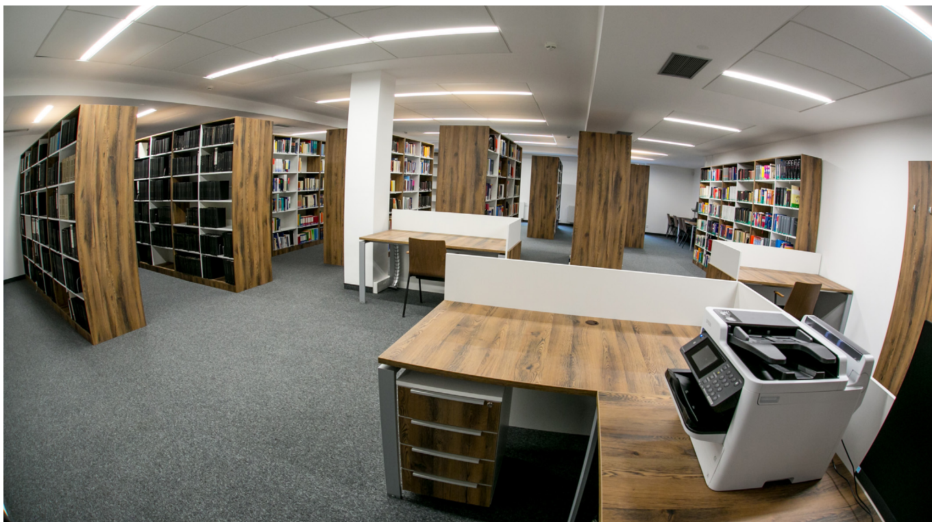
Knihovna Nejvyššího soudu si důstojné zázemí zasloužila. Více než čtvrtstoletí sídlila v provizoriu.