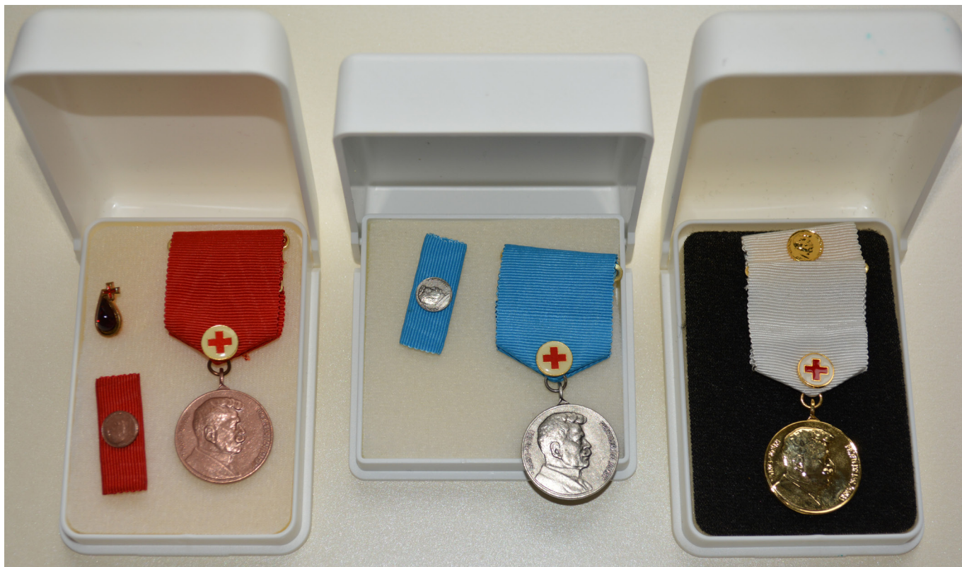
Janského plakety - zlatá, stříbrná, bronzová.