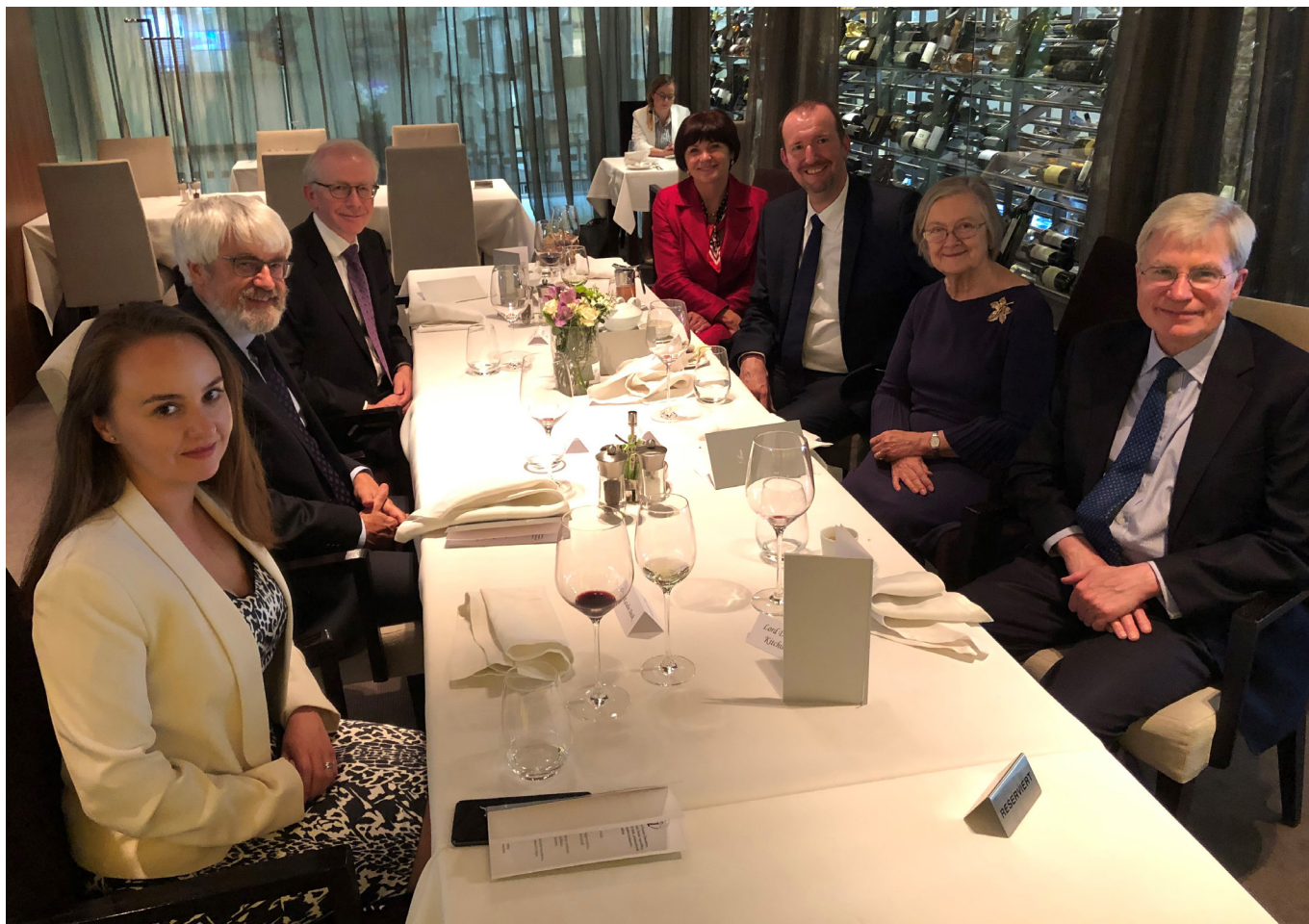
Fotografie ze slavnostní večeře u příležitosti návštěvy lady Hale, předsedkyně Nejvyššího soudu Spojeného království. Paní předsedkyně (sedící uprostřed vedle Pavla Simona) přiletěla na pozvání předsedy Nejvyššího soudu Pavla Šámala do Brna v červnu 2019 v doprovodu místopředsedy Nejvyššího soudu Spojeného království lorda Reeda a soudce lorda Kitchina.

ESLP se podařilo v minulých letech výrazně snížit obrovský počet nevyřízených věcí. Bohužel ale ke snížení došlo převážně u stížností, které bylo možno odmítnout pro nepřijatelnosti, tj. u věcí jednoduchých. Složitě kauzy, které na ESLP leží v řádech desítek tisíc, se vyřídit nepodařilo a jejich vyřizování se táhne roky. I pro ESLP přitom platí, že spravedlnost poskytnutá pozdě jako by nebyla poskytnuta vůbec.