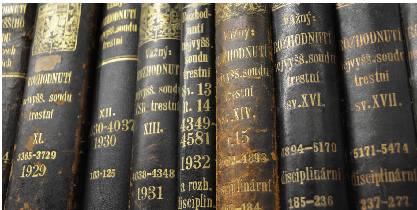
Sbírký rozhodnutí Nejvyššího soudu ve věcech civilních a trestních, známé pod názvem „Vážného sbírky“.

Knižní fond, tedy včetně elektronických nosičů, se ročně rozrůstá o další stovky položek, například v roce 2020 přibylo téměř 330 nových exemplářů. Ve speciálním skladu, aby netrpěly na přímém slunci, se nacházejí také vzácné staré tisky. Mezi nimi třeba 35 exemplářů z 18. století, dalších 885 knih pochází z 19. století. Nejstarším exemplářem knihovny Nejvyššího soudu je kalendář z roku 1748 Neuer Prager Tytular und Logiaments Calendar zu Ehren des H. Wenceslai, Fürsten, Martyrers und Patrons des Königreichs Böhmeim auf das Jahr 1749.