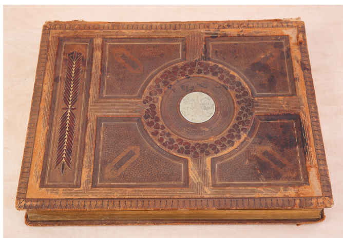
Vzácná kožená alba s fotoportréty všech soudců Nejvyššího soudu z let 1918 až 1938.