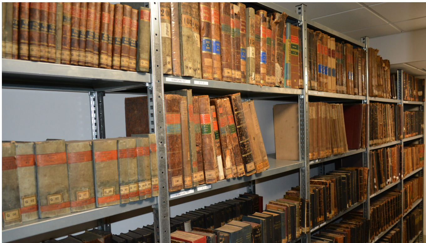
Vzácné staré tisky jsou ve skladu knihovny, aby netrpěly na přímém slunci.

Knižní fond, tedy včetně elektronických nosičů, se ročně rozrůstá o další stovky položek, například v roce 2020 přibylo téměř 330 nových exemplářů. Ve speciálním skladu, aby netrpěly na přímém slunci, se nacházejí také vzácné staré tisky. Mezi nimi třeba 35 exemplářů z 18. století, dalších 885 knih pochází z 19. století. Nejstarším exemplářem knihovny Nejvyššího soudu je kalendář z roku 1748 Neuer Prager Tytular und Logiaments Calendar zu Ehren des H. Wenceslai, Fürsten, Martyrers und Patrons des Königreichs Böhmeim auf das Jahr 1749.