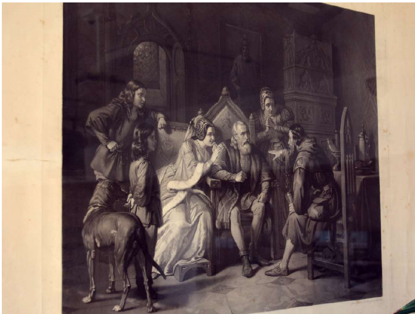
Obraz zapůjčený z Národního památkového ústavu, územní památkové správy v Kroměříži, Státního zámku Lysice: Vypravěč, autor L. Löffler, litografie Leo Schöninger, konec 19. stol.