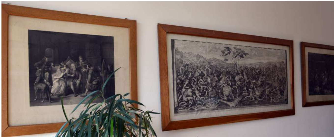
Trojice obrazů zapůjčená z Národního památkového ústavu, územní památkové správy v Kroměříži, Státního zámku Lysice.