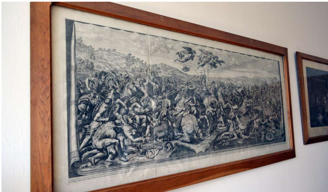
Bitva, mědirytina – papír, 18. stol., autor Dominicus de Rossi.