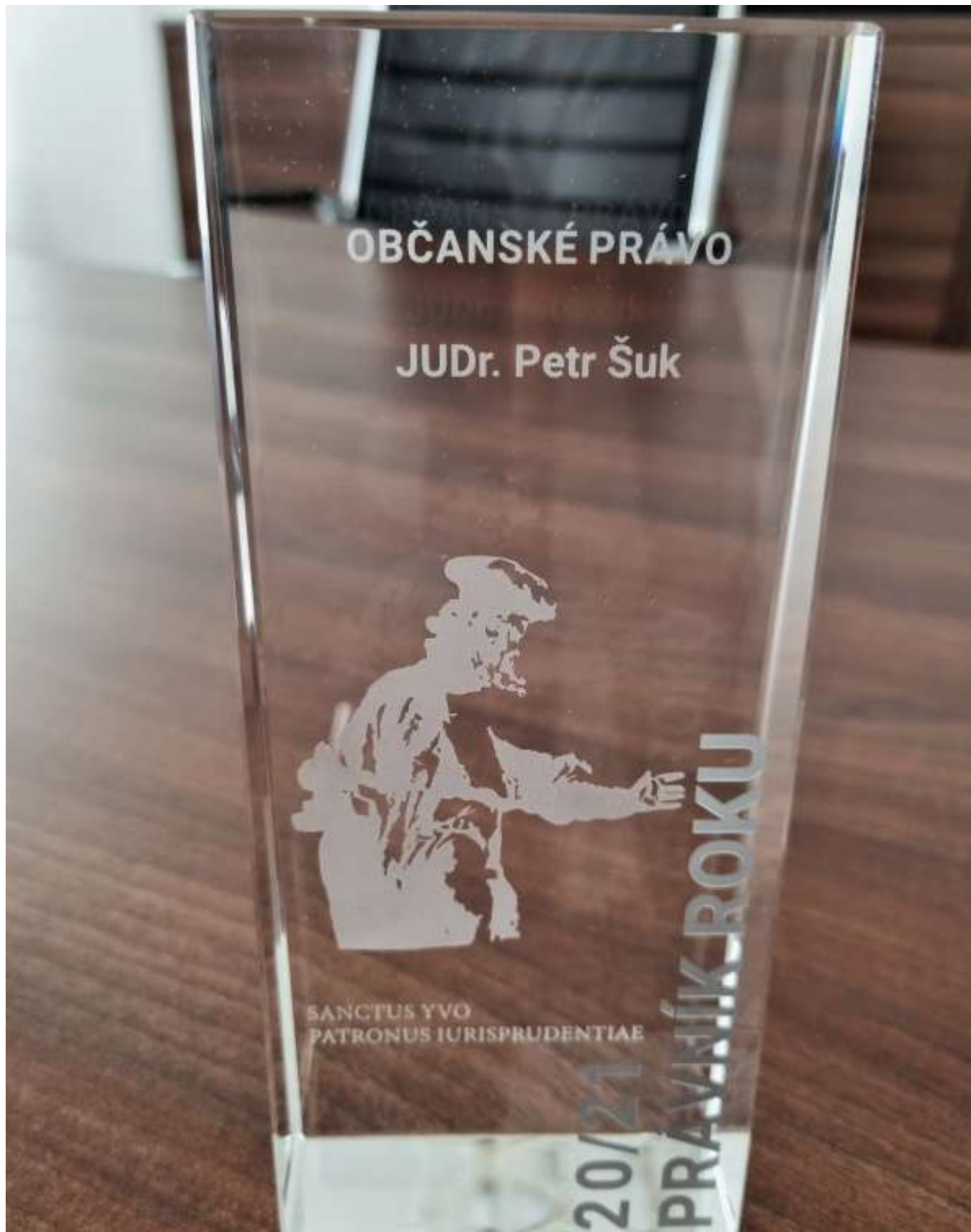
Svatý Yvo, tradiční cena pro Právníka roku.