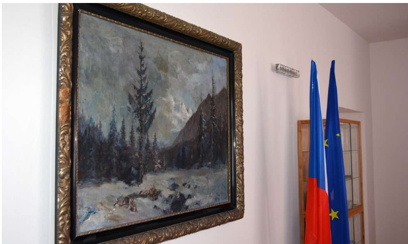
Velkoplošný obraz v zasedací místnosti předsedy Nejvyššího soudu.