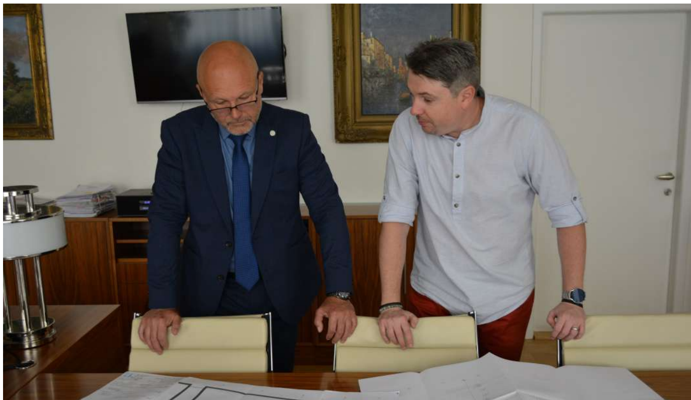
Roman Krupica diskutuje nad projektem rekonstrukce jednacího sálu s předsedou Nejvyššího soudu Petrem Angyalossym.

zaměstnanců státní správy, nicméně pokud jsou naše argumenty řádně odůvodněny, tak si nemyslím, že by neměly být oslyšeny.