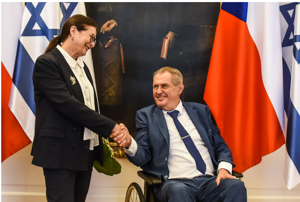
Přijetí Esther Hayut u prezidenta Miloše Zemana.