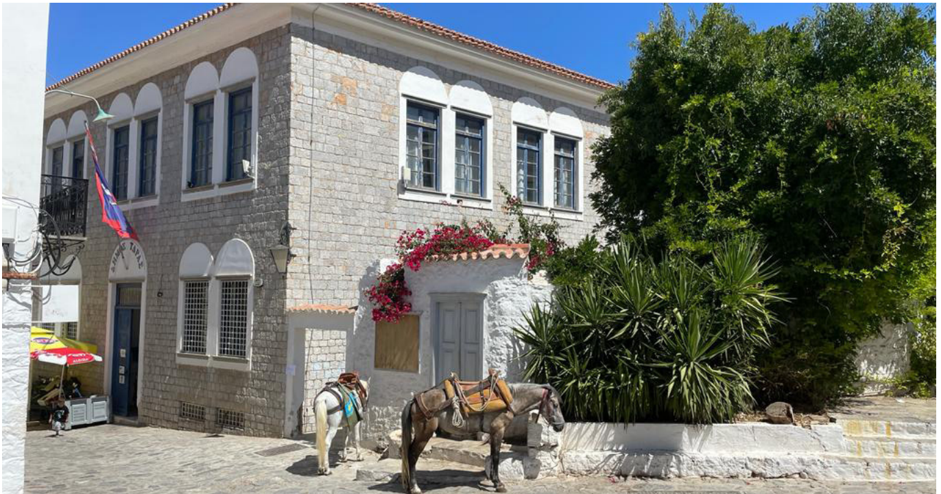
Řecký ostrov Hydra a budova tamní radnice, kde se mezinárodní konference Evropské asociace soudců pracovních soudů konala.

skříňky, do které jdou vstupy a pomocí ne zcela srozumitelných algoritmů z ní vystupují výstupy, které by měl soud v případném sporu zanalyzovat. A tak vznikají pochopitelné otázky, jak si s tím poradí stávající právní instituty. Například na poli diskriminace je možné využít obráceného (sdíleného) důkazního břemene, z již existujících teorií by mohla pomoci teorie vysvětlující povinnosti strany nezátížené důkazním břemenem.