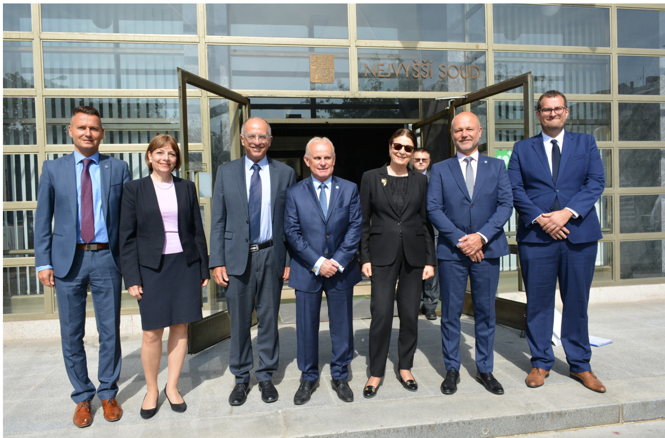
Účastníci dopoledního pracovního jednání 13. září na společné fotografii před budovou Nejvyššího soudu.