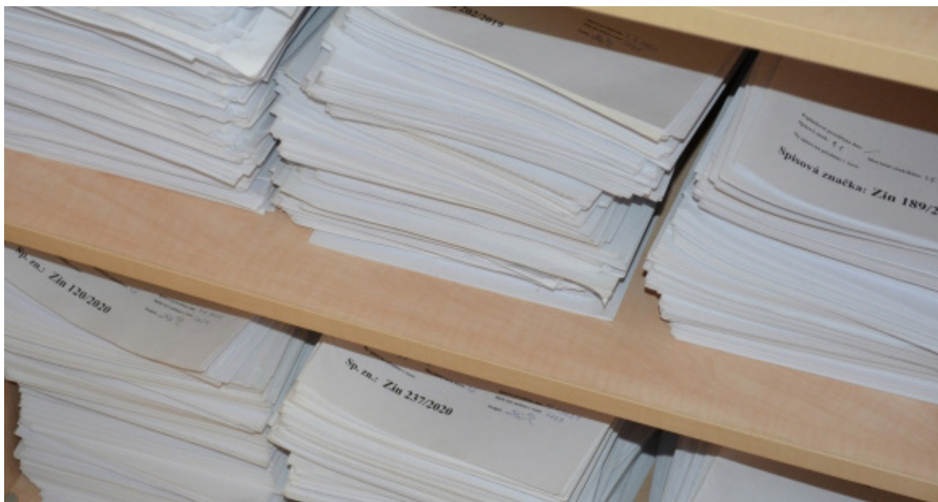
Spisy s jednotlivými vyřízenými žádostmi o informace.

Vyřizování žádostí může komplikovat i jejich podání přes „prostředníka“ – např. přes webový portál infoprovsechny.cz . Uvedený web sice zvětšuje transparentnost řízení a umožňuje