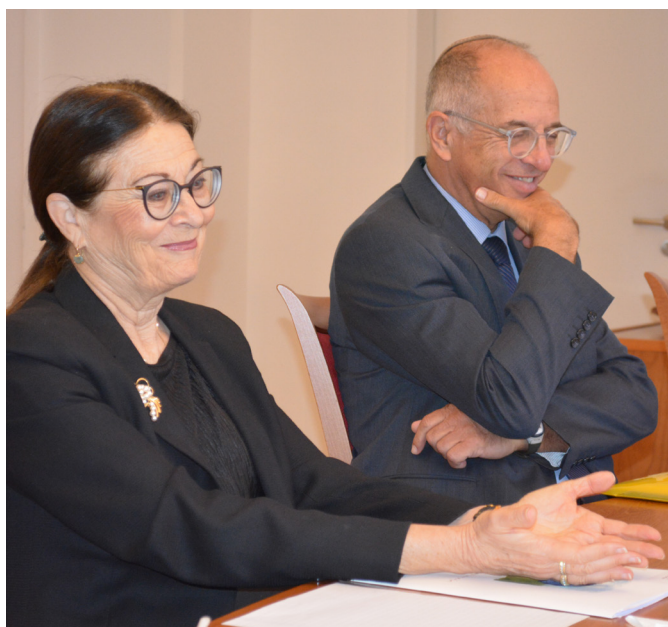
Esther Hayut je služebně nejstarší soudkyní Nejvyššího soudu Státu Izrael, proto je automaticky jeho předsedkyní. Služebně druhým nejstarším soudcem je Noam Sohlberg (napravo).