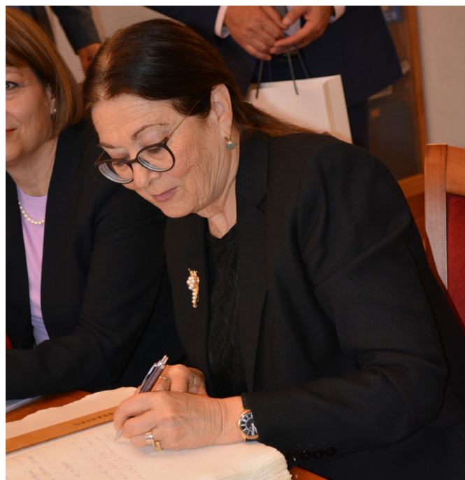
Návštěvu Esther Hayut bude Nejvyššímu soudu připomínat její zápis do pamětní knihy.