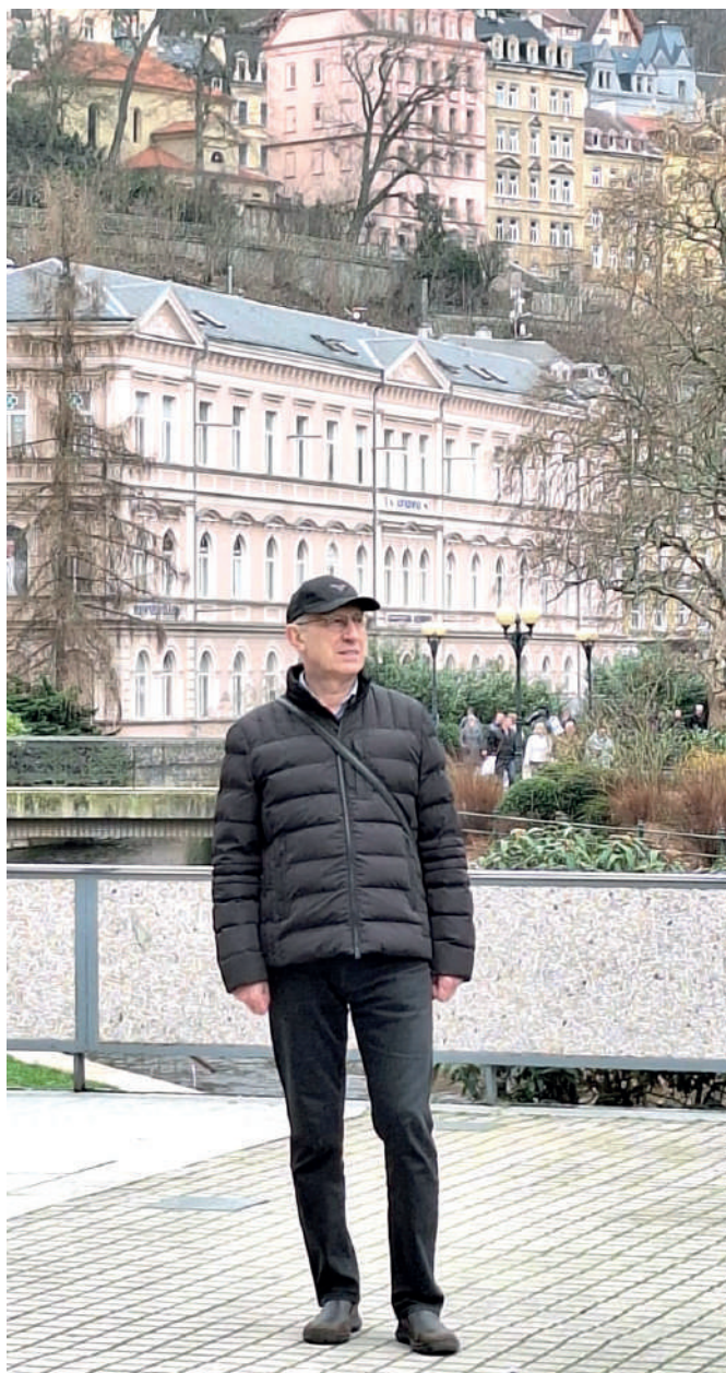
Na dovolené v Karlových Varech.

Jeho záměrem bylo, aby trestní řízení v té daňové věci vyšlo do prázdna a on se v důsledku nepoužitelnosti opatřených důkazů z celé věci dostal. V té naší věci jsme pak vyslovili, že motivace pachatelů může být různá, např. již zmíněná ziskuchtivost, ale i msta, náboženské či jiné důvody... a pokud k tomu vytvoříte uskupení lidí, které má odpovídající hierarchii, a jsou naplněny i ostatní potřebné znaky obsažené v § 129 trestního zákoníku, jedná se o organizovanou zločineckou skupinu.