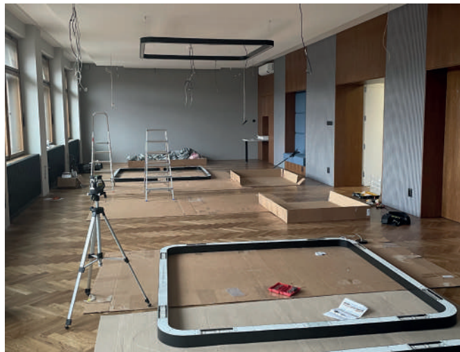
Prostor doplňují svěšená čtvercová svítidla.

Původní topení, které je v místnosti zachováno, nově zakrývá kovové žebrování v černé barvě, které evokuje funkcionalistické prvky vyskytující se v budově. Výsuvná část žebrování slouží jako elegantní řešení přístupu k termostatické hlavici topení. Mezi žebrování jsou umístěny závěsy ze stejné látky a ve stejné barvě, jako je čalounění v boxech. Kromě hlavní funkce, kterou je zastínění prostoru, se jedná o další akustický, ale i estetický prvek.