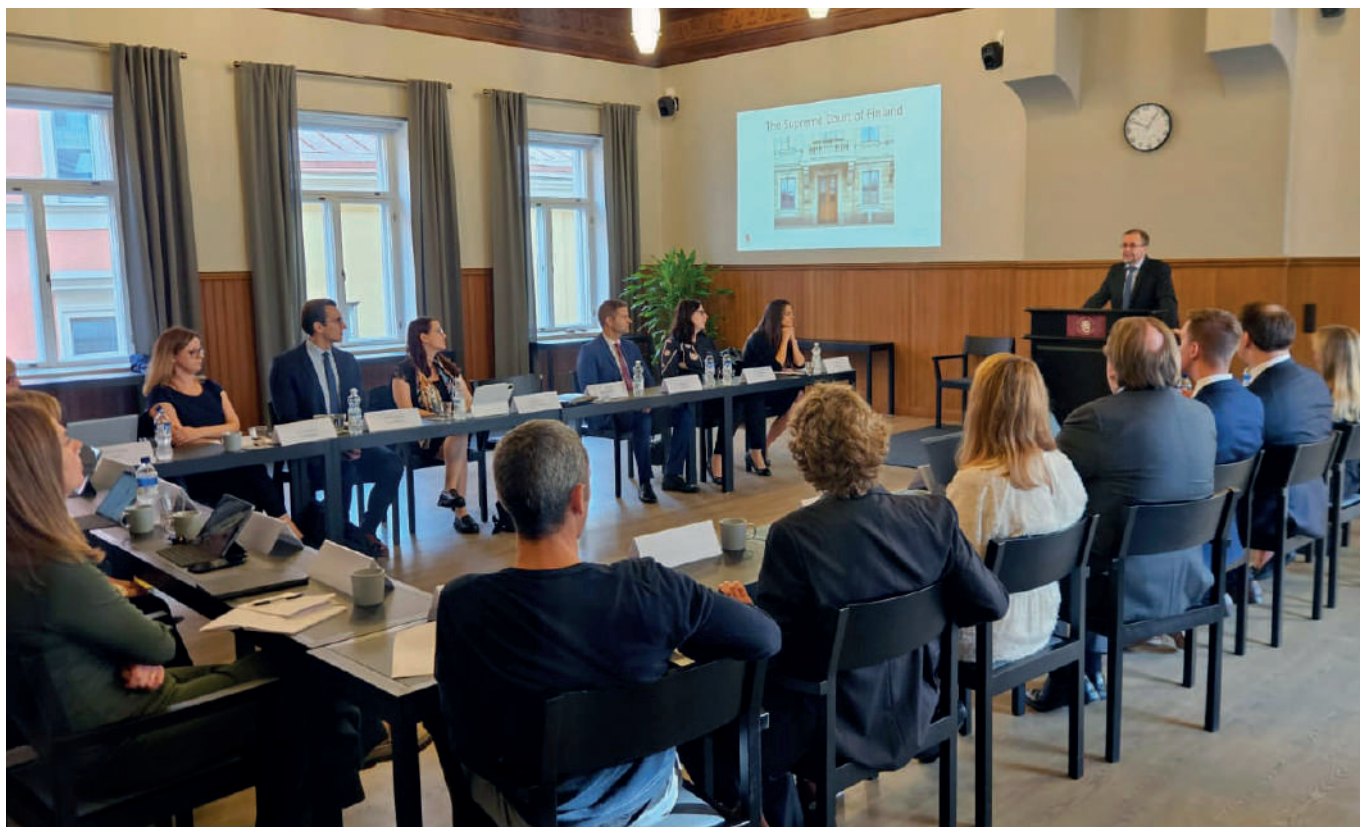
Jednání probíhalo na Nejvyšším soudu Finska.