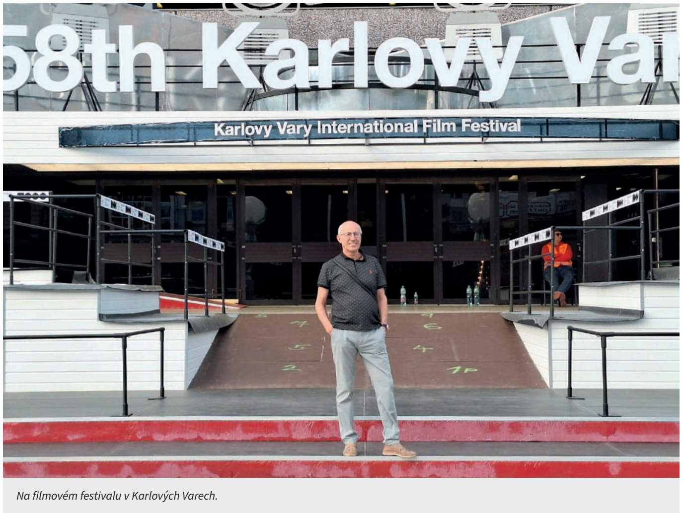
Na filmovém festivalu v Karlových Varech.

Rozhodoval jste i případy krádeží během pandemie covid-19. Váš senát na tento typ krádeží nahlížel poněkud přísněji, nakonec zasedl velký senát a ten rozhodl, že se drobné krádeže za pandemie, které v té době vyložené nesouvisely s krádežemi například zdravotnických pomůcek, bude nahlížet s mírnější trestností. Proč jste se tehdy přiklonili k přísnějšímu postihu?