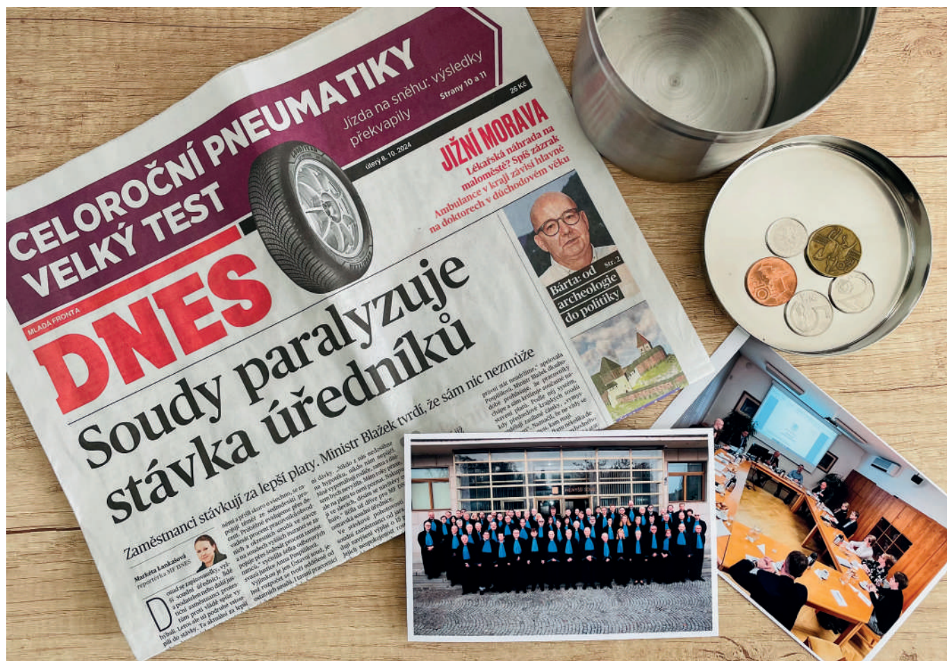
Využili jsme rekonstrukci k vložení časové schránky za jednu z přiček.

Původní topení, které je v místnosti zachováno, nově zakrývá kovové žebrování v černé barvě, které evokuje funkcionalistické prvky vyskytující se v budově. Výsuvná část žebrování slouží jako elegantní řešení přístupu k termostatické hlavici topení. Mezi žebrování jsou umístěny závěsy ze stejné látky a ve stejné barvě, jako je čalounění v boxech. Kromě hlavní funkce, kterou je zastínění prostoru, se jedná o další akustický, ale i estetický prvek.