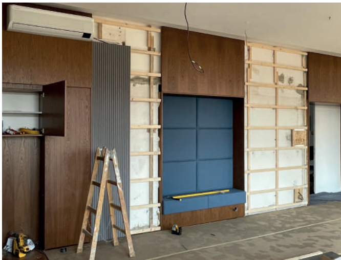
Dlouhá stěna je doplněna o akustické panely a niky sloužící jako prostor k sezení.