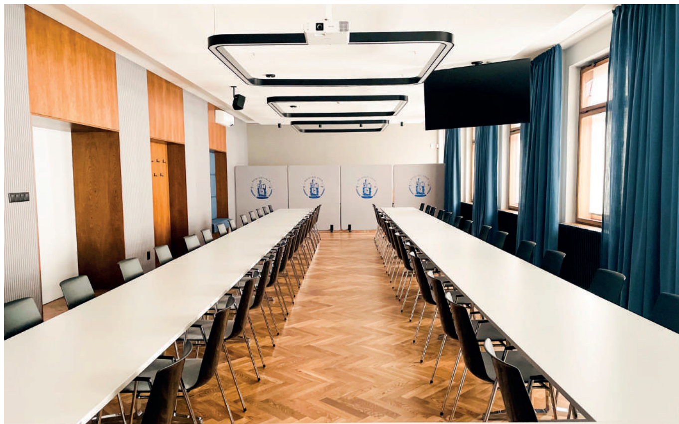
Místnost 228 po rekonstrukci.