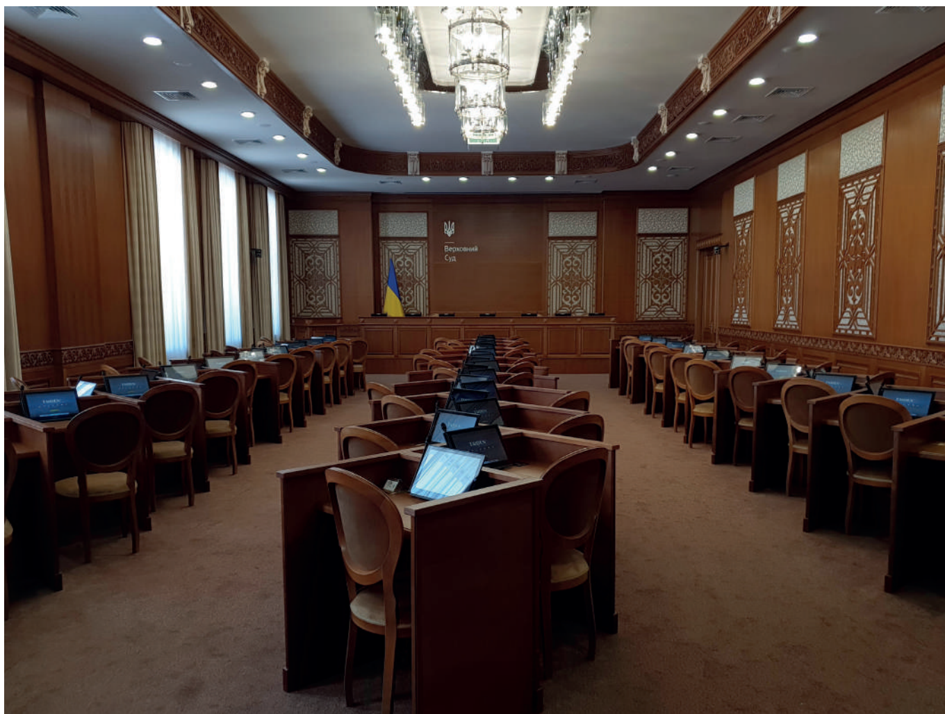
Konferenční místnost občanskoprávního kolegia Nejvyššího soudu Ukrajiny.

Jakmile poplašný signál signalizuje balistickou hrozbu (rakety nebo drony), všichni zaměstnanci soudu se musí přemístit do protileteckého krytu. Během leteckého poplachu je soudní jednání přerušeno, soud musí jednání odložit.