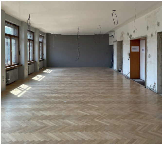
Podlaha před renovací.