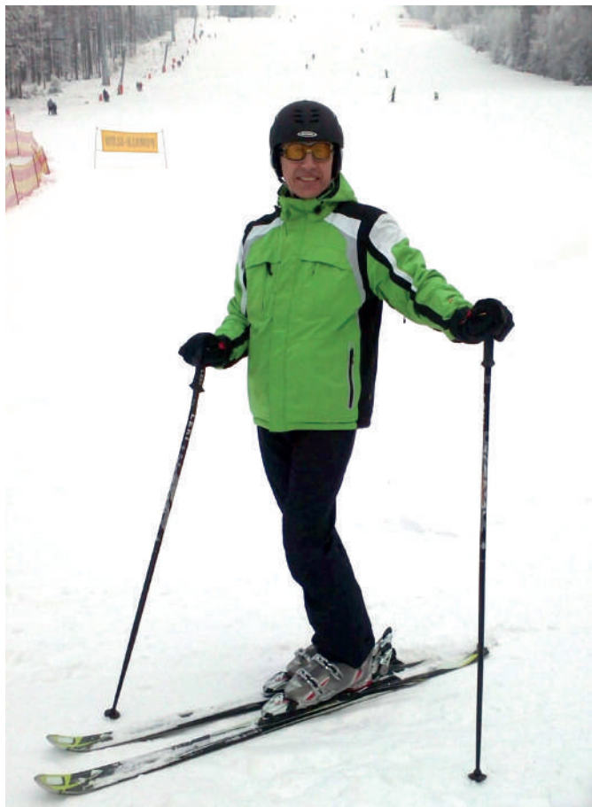
Jeho oblíbeným koníčkem je lyžování.