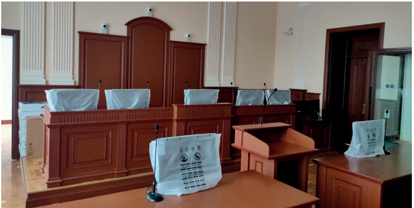
Soudní síň občanskoprávního kolegia Nejvyššího soudu Ukrajiny.

ptají na informace, zda je určitá oblast na Ukrajině (město nebo obec) pod okupací Ruska, (nebo zda v této oblasti probíhají nějaké vojenské operace). Z mého pohledu se jedná o pozitivní trend, neboť tyto informace přispějí ke spravedlivému a komplexnímu posouzení případu s ohledem na nejlepší zájem dítěte.