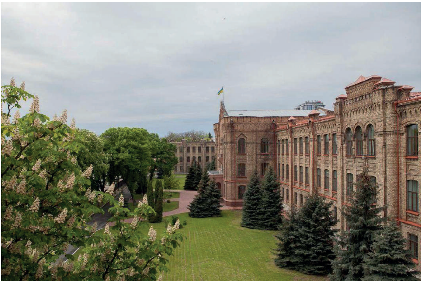
Občanskoprávní kolegium Nejvyššího soudu Ukrajiny.

Od začátku ruské války na Ukrajině se většina žádostí týká případů mezinárodních rodinných únosů dětí a uplatňování Haagské úmluvy o občanskoprávních aspektech mezinárodních únosů dětí z roku 1980. Častěji se mě soudci zahraničních soudů, kteří rozhodují o návrzích o navrácení ukrajinského dítěte, prostřednictvím IHNJ