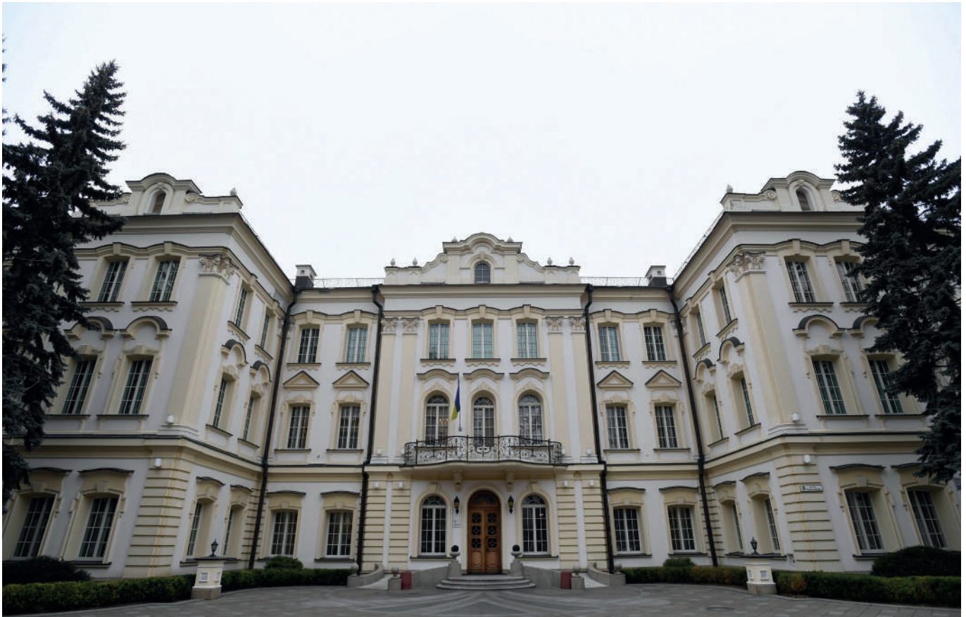
Klovsky palace - sídlo Nejvyššího soudu Ukrajiny.