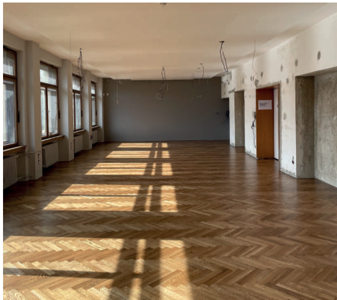
Po vybroušení a lakování podlaha „prokoukla“.

V prosinci byla dokončena rekonstrukce tzv. „dvěstědvacetosmičky“, místnosti, která slouží jako zasedací místnost. Probíhají zde menší školení, jednání, ale i další akce, které Nejvyšší soud pořádá.