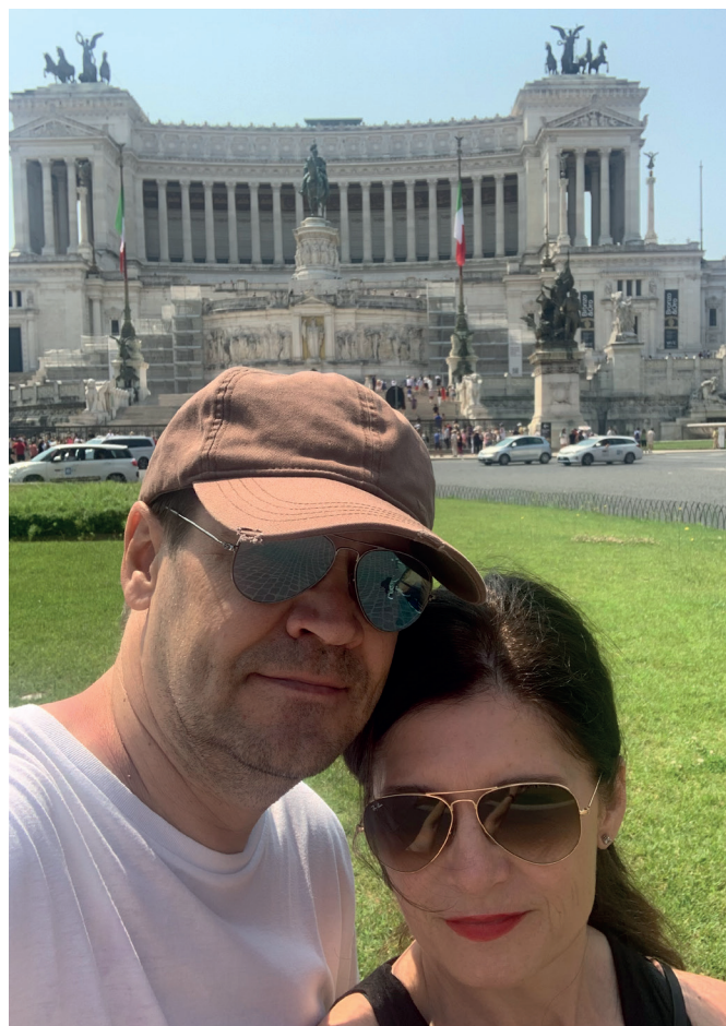
Na společné dovolené s manželkou v Římě.