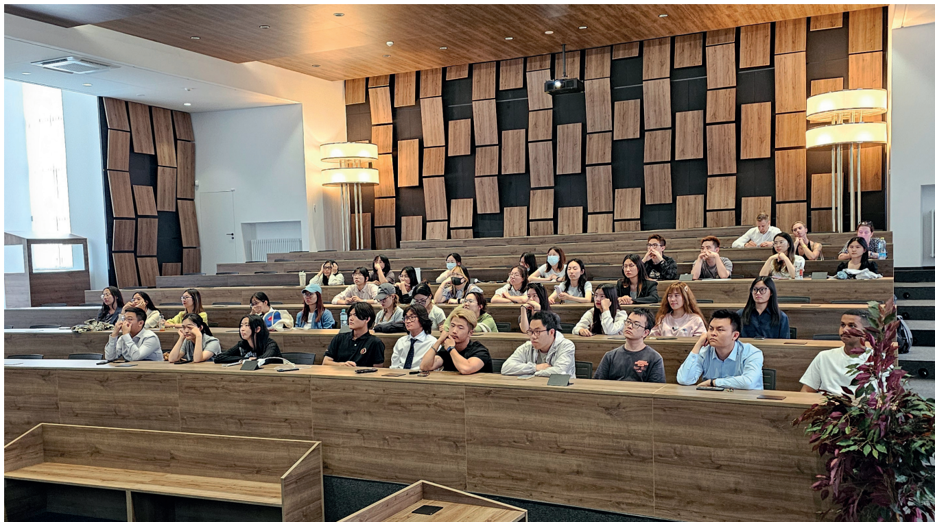
Studenti zavítali také do Sálu Františka Vážného.