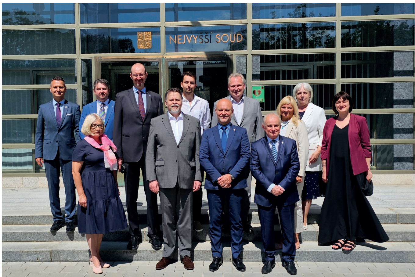
Společná fotografie před budovou Nejvyššího soudu.

Ve dnech 6.–8. srpna 2024 navštívila Českou republiku výprava Nejvyššího soudu Lotyšska. Delegace v čele s předsedou lotyšského Nejvyššího soudu Aigarsem Strupišsem usilovala o výměnu konkrétních poznatků a dobré praxe z různých aspektů fungování našich justičních institucí. V tomto směru cílila na diskusi se zástupci Nejvyššího soudu a Justiční akademie. Na Nejvyšší soud delegace zavítala 7. srpna.