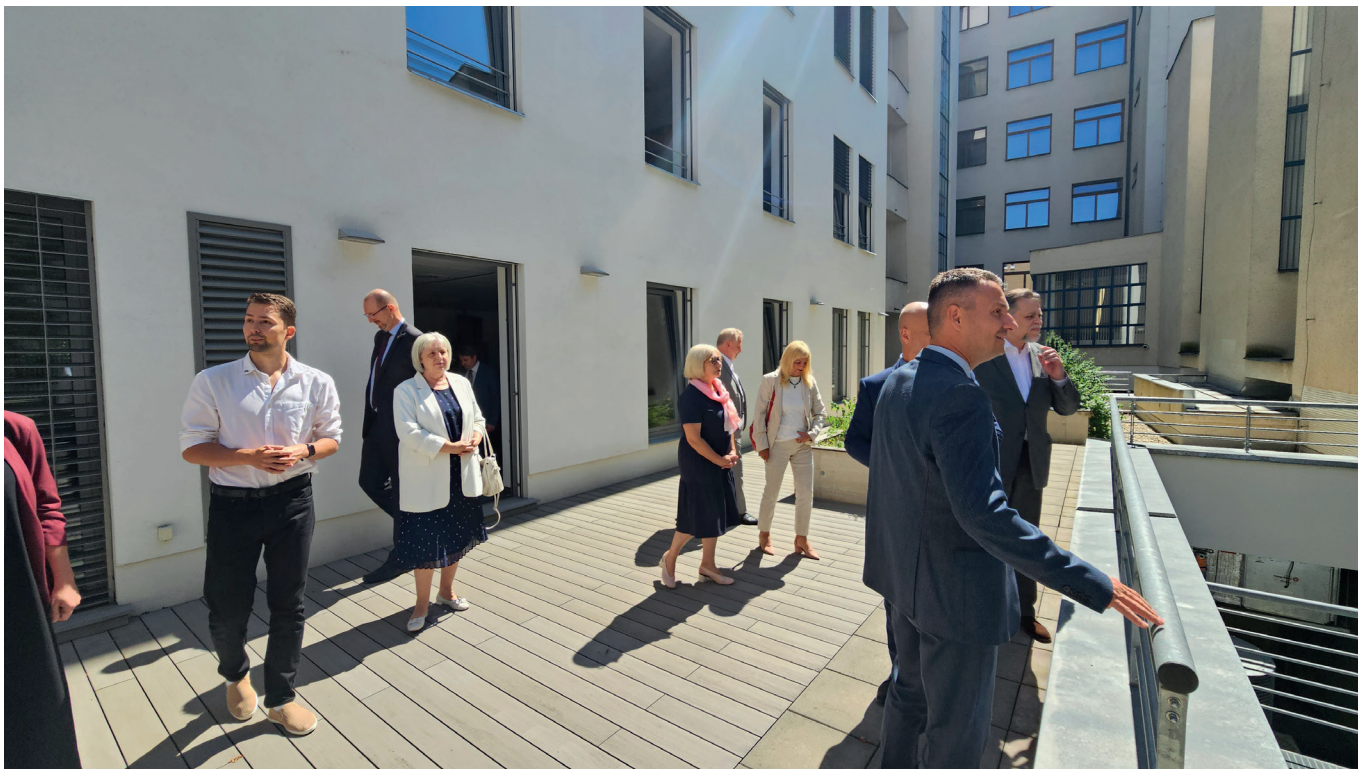
Delegace si kromě interiéru budovy mohla prohlédnout i venkovní část s terasou, která je umístěna ve vnitrobloku.