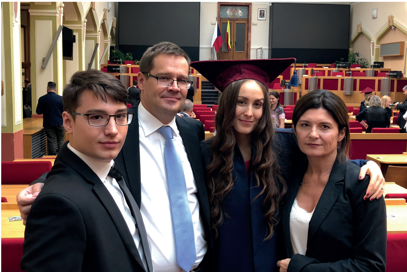
Rodinná fotografie z promoce dcery.

soudu. Tehdy byl ještě nedostatek soudců, takže jsme si dokonce mohli vybrat, jestli chceme na civil nebo na trest. Já jsem i díky své předchozí praxi měl blíž k civilu, takže to byla jasná volba. Nakrátko jsem z té cesty sice uhnul, když jsem nějakou dobu působil na správním úseku Městského soudu v Praze, ale na civilní úsek jsem se vrátil.