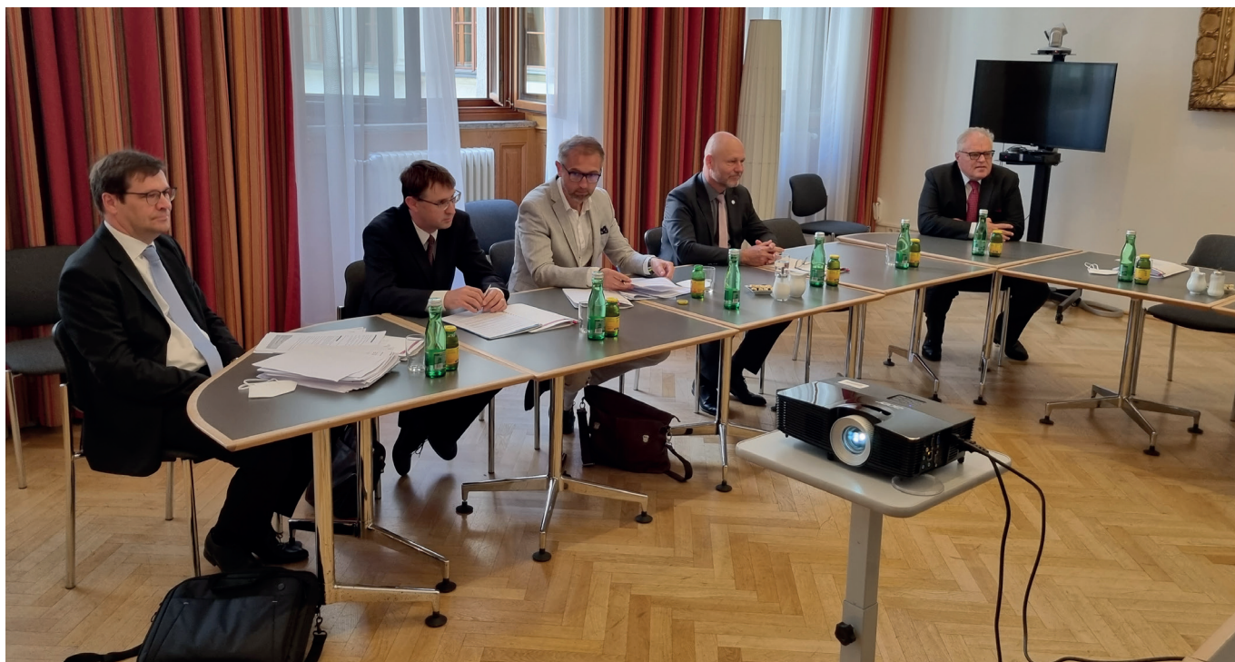
Ve Vídni se zúčastnil pracovního jednání na tamním Nejvyšším soudu.

To je obtížně uchopitelná a složitá otázka. Jako praktik vnímám, že se české občanské právo neustále mění. Je to proces, mění se předpisy, vyvíjí se judikatura a mění se i náhled nás všech na jeho podobu i na způsob jeho uplatňování. Vždycky je co zlepšovat, problém je, že každý z nás má představu o tom, co a jak zlepšit, trošičku jinou. Jeden prosazuje, aby předpisy byly celkově útlejší a stručnější, jiný oponuje, že předpis má být návodný a podrobný. Často proklamované, že každý právní předpis by měl být tak jasný, aby mu každý porozuměl při jeho čtení, je ovšem chiméra. Právo je složitý a velice komplikovaný obor. Představa, že by mu měl rozumět každý, se mívá právě s tím, jak složitě a komplikovaně právo je. Pro srovnání, stejně jako si běžný člověk dokáže poradit s běžnou virózou, tak si patrně neporadí s poruchou štítné žlázy nebo se zlomenou nohou. A po doktorech taky nikdo nechce, aby léky a léčení přizpůsobili tak, aby tomu každý rozuměl.