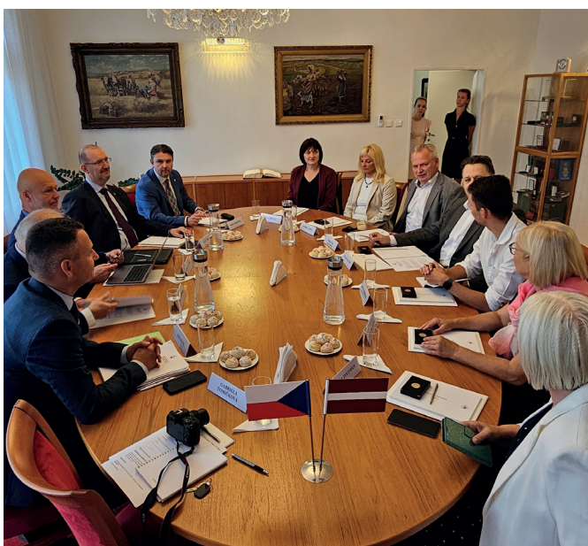
Zástupci nejvyšších soudů si vyměnili poznatky o fungování justice v obou zemích.