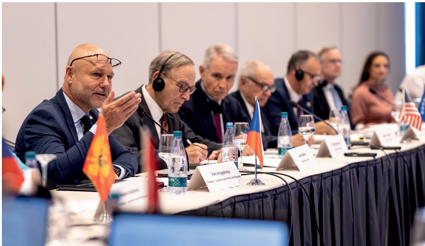
Konference umožňovala otevřenou diskusi o fungování soudnictví mezi předsedy soudů.

Předseda Nejvyššího soudu Petr Angyalossy se v doprovodu ředitele své kanceláře Aleše Pavla zúčastnil setkání předsedů nejvyšších soudů zemí střední a východní Evropy, které se konalo v kosovské Prištině. Jednalo se již o 14. takovéto setkání, tentokrát i při příležitosti 60. výročí založení Nejvyššího soudu Kosova.